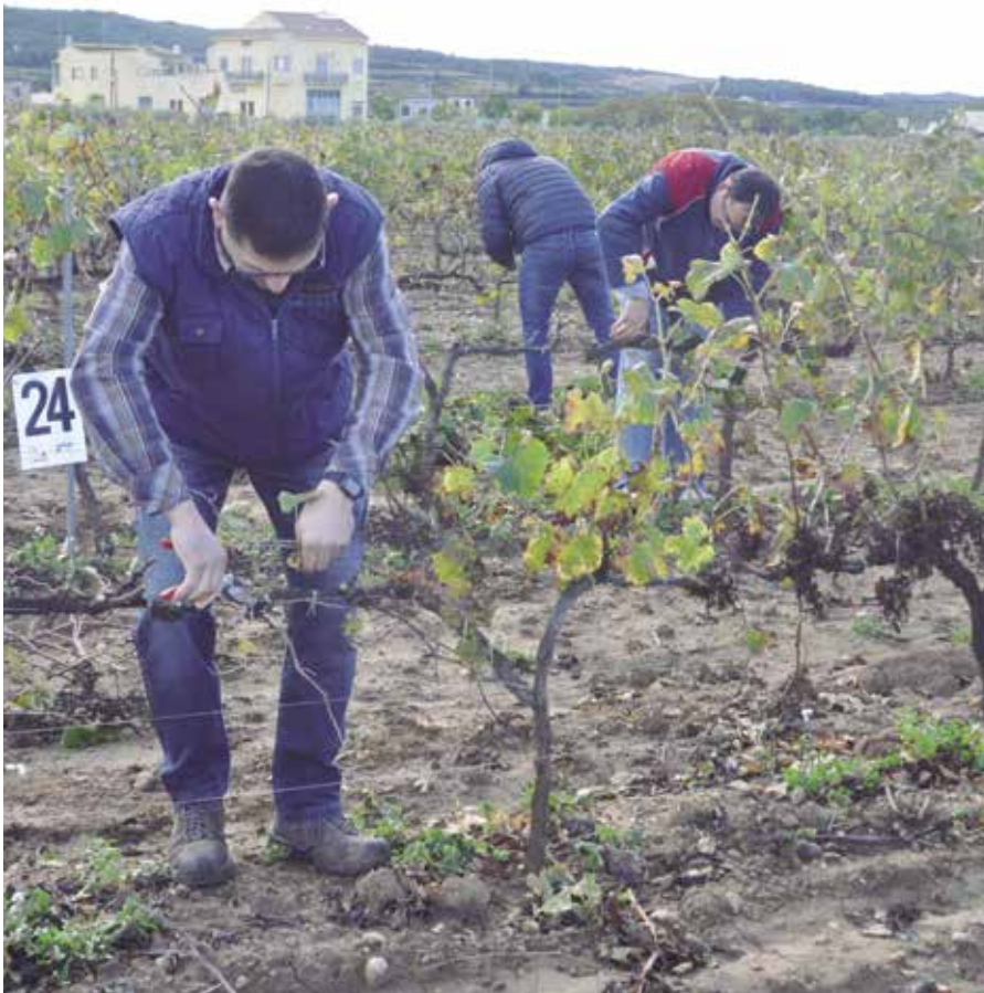
El concurs de poda és un dels clàssics de la Festa del Most.