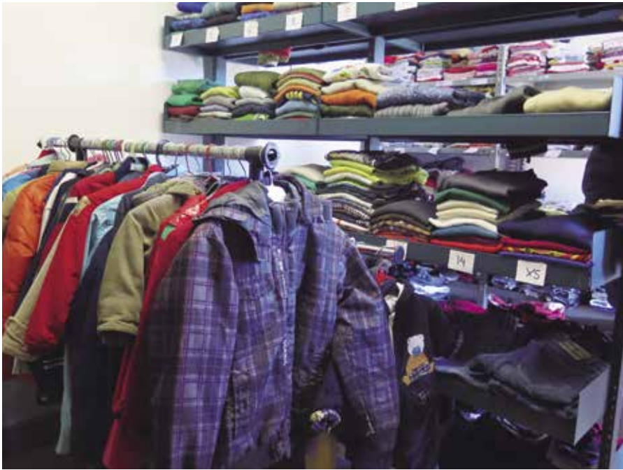
Banc de roba.