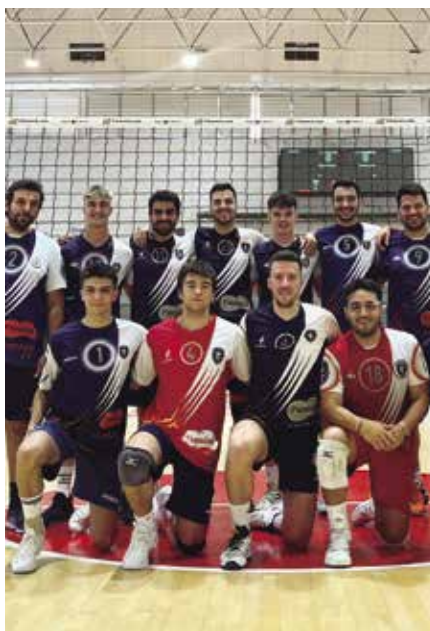
Sènior Masculí del Volei Monjos

El primer equip en donar el tret de sortida de la temporada va ser el sènior femení, que començà la competició el dissabte 23 de setembre.