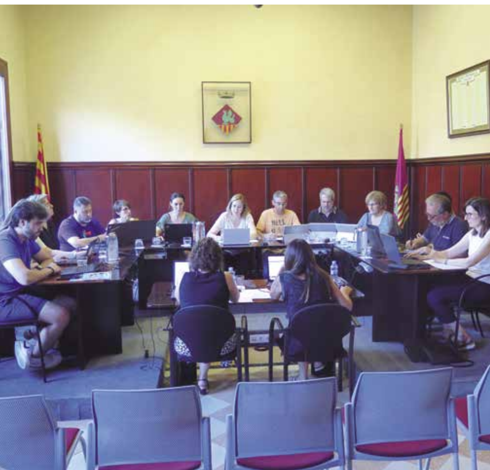
Ple municipal del passat mes de juliol.

El ple municipal va aprovar el passat mes de juliol, per unanimitat, la xifra oficial del padró municipal d'habitants a 1 de gener de 2023 amb 7.650 persones (3.885 homes i 3.765 dones); els festius locals de l'any vinent i la delegació a la junta de govern per sancionar en cas de comissió d'infraccions greus o molt greus per tinença de gossos perillosos, amb els vots a favor del PSC i PA, l'abstenció d'ERC i JUNTS i el vot en contra de PL.