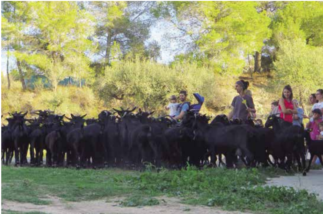
El ramat de Camins de Vida a Penyaforç.

La mostra, que enguany arriba a la vuitena edició, inclourà un mercat i degustació de vins, caves, formatges i embotits. Durant tot el matí es podrà visitar també el mercat d'artesanía i brocanters, així com una mostra d'ovelles dels pastors locals i l'exposició "El Camí ramader de Marina". A més es faran activitats infantils relacionades amb el món pastorívol i amb la novetat del Joc Transhumant.