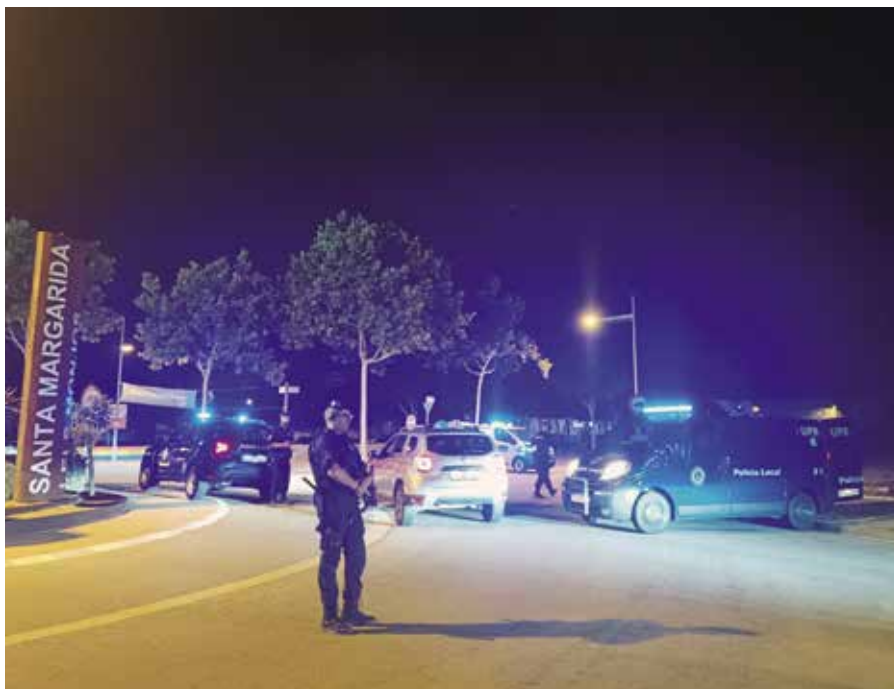
Actuacions de la unitat especialitzada

La unitat especialitzada en seguretat ciutadana de la Policia Local (UPR) de Santa Margarida i els Monjos acaba de complir 10 anys. Es tracta d'una unitat especial creada l'any 2013 arran d'uns esdeveniments que es van produir durant les festes majors d'aquell estiu, on les unitats bàsiques de seguretat ciutadana, juntament amb les del cos de Mossos d'Esquadra, van resultar desbordades per problemes d'ordre públic.