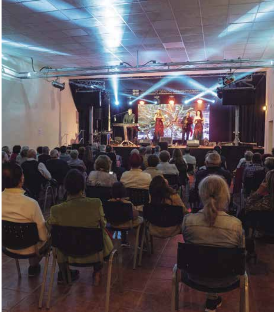
La Sala és un dels espais emblemàtics de la Festa Major de Cal Rubió.