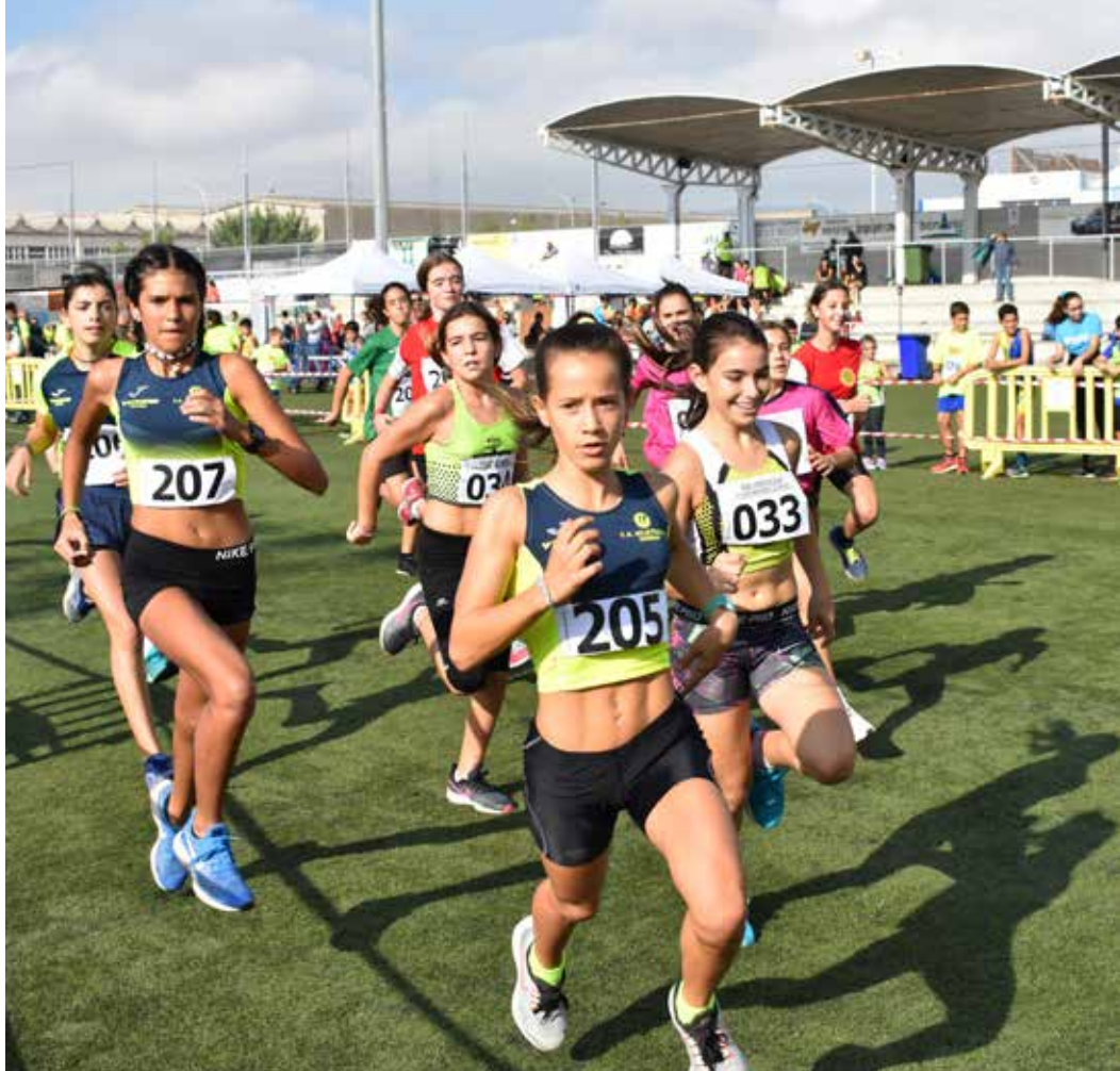
Centenars de petits atletes corren cada any el cros.

El cros es fa amb la col·laboració de les AMPA de les escoles Doctor Samaranch, Arrels, Sant Domènec, l'institut del Foix i el Consell Esportiu de l'Alt Penedès, organitza el proper dissabte 21 d'octubre, la matinal atlètica del municipi amb la celebració del cros escolar i les