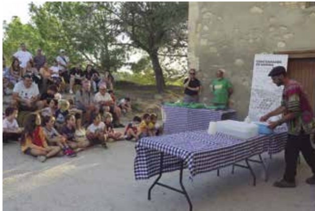
La interacció del ramat i els pastors amb el públic i l'alumnat del municipi.

de Marina. De la Cerdanya al Penedès, per posar en valor els pastors/es, els camins ramaders i els valors de sostenibilitat, biodiversitat i prevenció d'incendis forestals a través del col·lectiu Ramats de Foc.