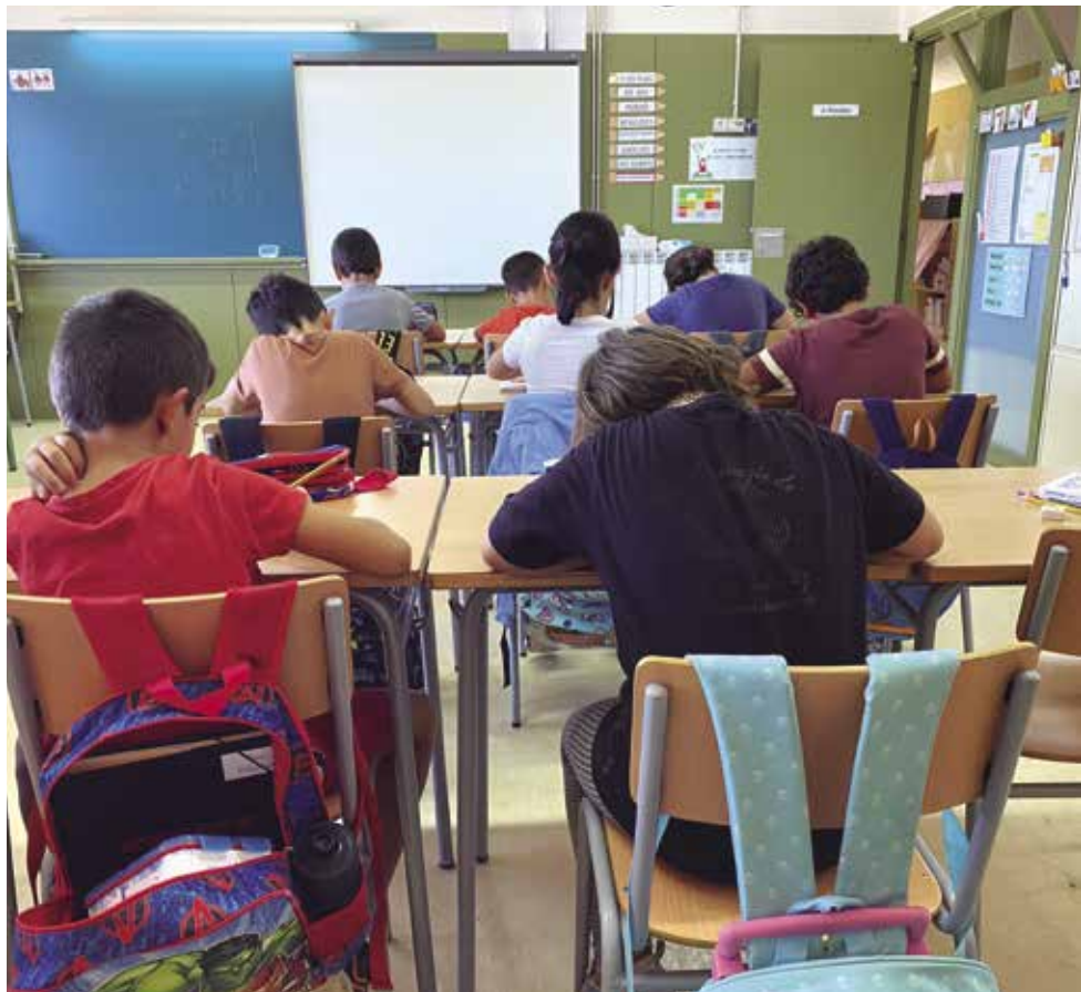
El curs escolar ha començat amb menys alumnes.

Destacar també d'inici de l'oferta formativa de l'escola de persones adultes Fina García, amb cursos de formació general, cursos d'accés a cicles formatius de grau mitjà i superior i des d'on