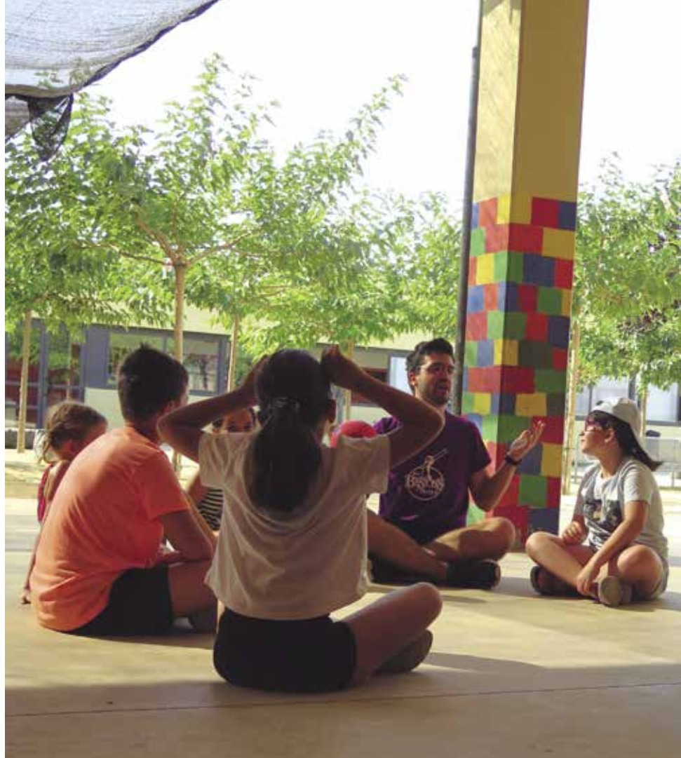
Grup de mitjans al casal d'estiu de la Ràpita

El casal també ofereix servei de menjador, del que gaudiran aquesta temporada una trentena de nens i nenes. Aquest servei s'ofereix únicament a l'escola Arrels, ja que a la Ràpita no hi ha hagut demanda aquesta edició. Com a novetat, aquest any també s'ha habilitat un autobús perquè els infants de la Ràpita es puguin desplaçar a la piscina municipal sense haver de caminar per l'eix cívic en hores de màxima calor.