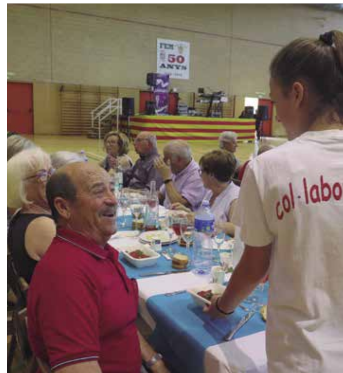
Festa de la Gent Gran 2023

En l'àmbit de la salut es van programar propostes com les xerrades que es van fer els dies 18 i 25 d'abril a la Ràpita sobre la lectura d'etiquetes o sobre els problemes d'oïda i el mareig, i la clàssica caminada A Cent Cap als Cent, amb caminaires de Begues, Cornellà i Santa Perpetua de la Mogoda.