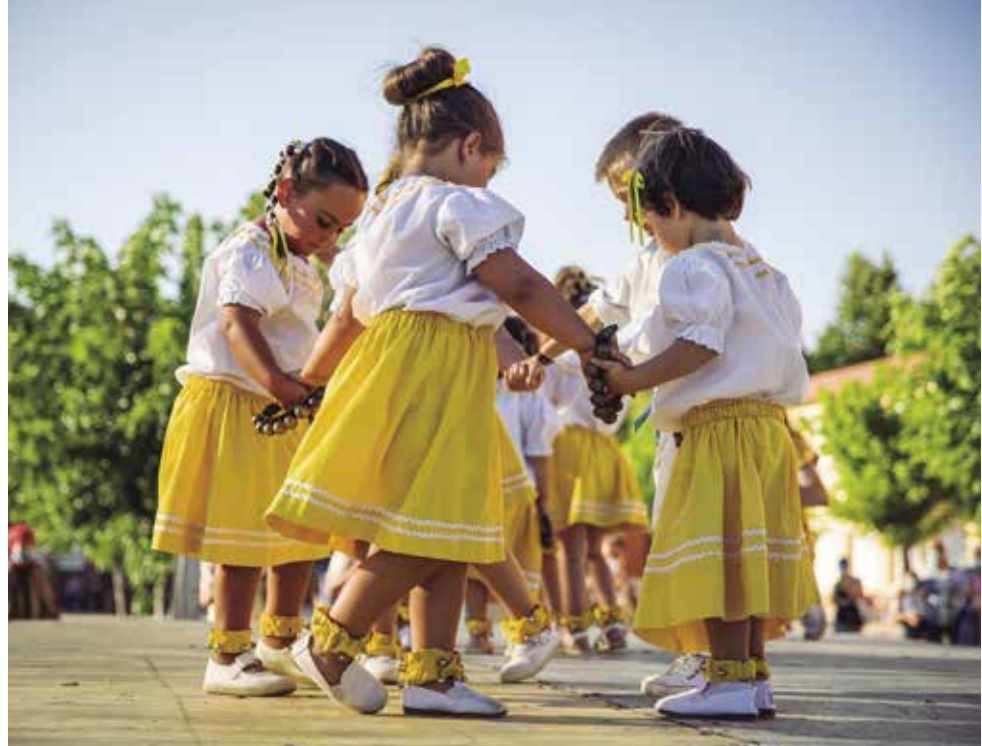
Ball de picarols

La Coordinadora de Balls dels Monjos ha organitzat aquest any una cercavila d'anada a ofici, el proper dia 20 de juliol, com a principal novetat de les propostes folklòriques de la festa major. Després de les matinades els balls faran un esmorzar festamajorenc i emprendran el recorregut entre la plaça de Pau Casals i la plaça de l'Església amb els balls grans. Aquest any la tradicional ofrena la farà el Ball de Picarols, que enguany celebra el seu vint-i-cinquè aniversari i que també serà protagonista d'una tro-