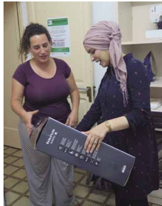
Primers donatius al Banc de les Coses

El passat 27 de juny el banc va dur a terme la primera recollida d'objectes, on veïns i veïnes del municipi van col·laborar de manera entusiasta aportant els seus articles, com ara màquines de cosir, ventiladors, planxes, etc. Aquest ha estat un primer pas fonamental per posar en marxa aquesta iniciativa comunitària que pot continuar rebent