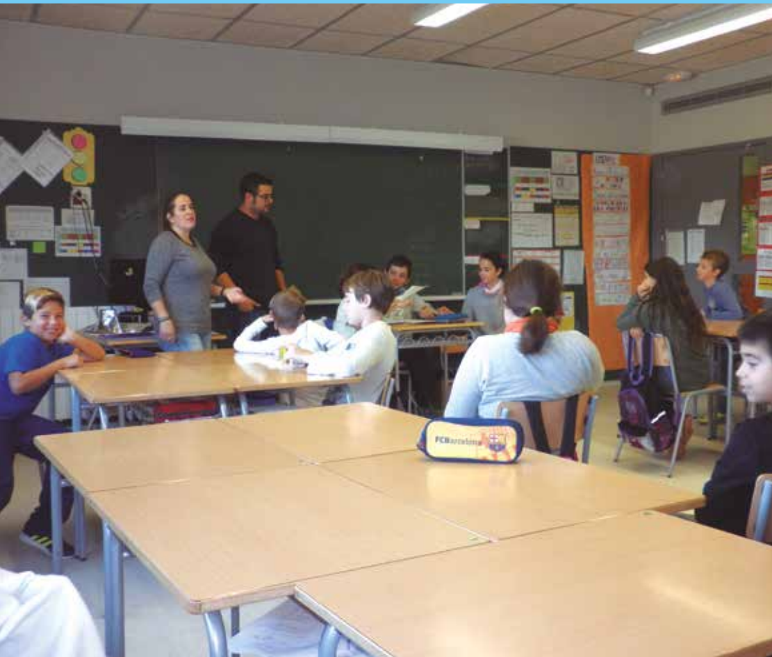
El CUEME fomenta el treball en equip