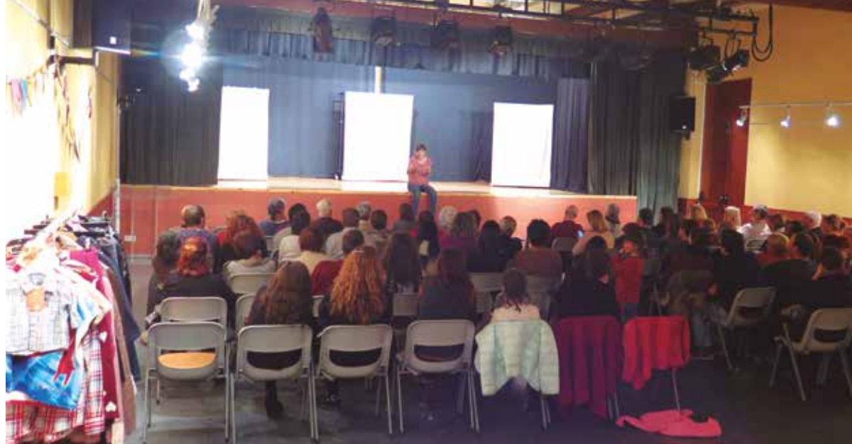
Teatre i debat per reflexionar sobre el consum de roba

En cadascun dels actes hi va haver un punt informatiu d'alternatives de consum de roba, com botigues de roba de segona mà, marques de roba de comerç just o pràctiques locals d'arranjament de peces de roba, tallers de roba artesana, marques i roba de proximitat, entre altres. ➤