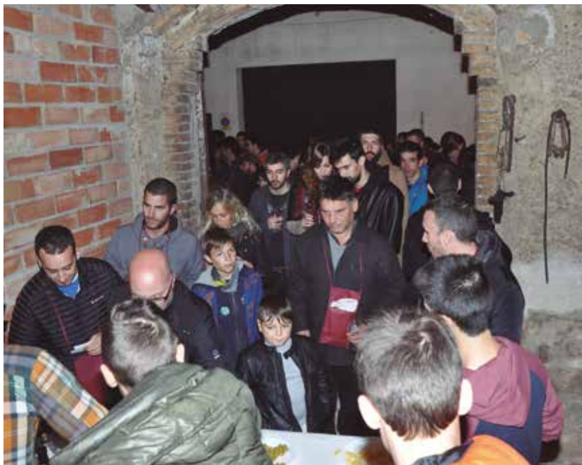
Èxit aclaparador del Correcellers

Les activitats de la festa van començar el primer cap de setmana amb la gimcana de tractors, el concurs de poda i el lliurament dels premis literaris Joan Mañé i Guillaumes. Al llarg de la setmana es van estar realitzant activitats com la tradicional nit de muntanyisme o una xerrada sobre viti-