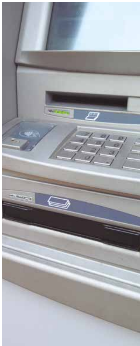
Nova taxa pels caixers

Les ordenances van ser aprovades amb els vots a favor del PSC i els vots contraris de PA-CUP, ERC i CIU.