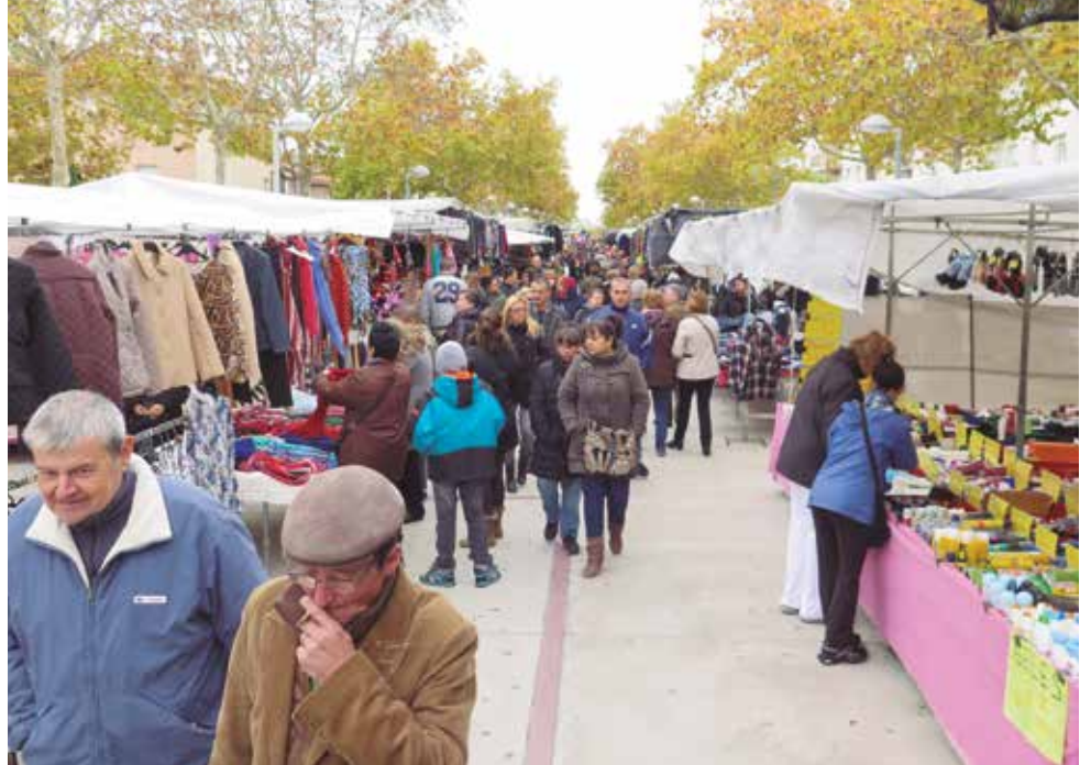
El mercat dels diumenges rep cada setmana uns 4.000 visitants

Des de l'Ajuntament es treballa de forma molt estreta amb l'associació del Comerç del Foix per aprofitar les sinèr-