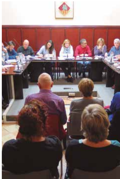
Audiència pública municipal

Seguidament es va iniciar el torn de paraula obert al públic assistent, que va poder formular preguntes i suggeriments variats, amb un debat que s'articulà entorn a temes com els processos judicials, l'estudi d'olors realitzat recentment per la UPC, les lluminàries de la via pública, algunes actuacions de la Policia Local, el manteniment de camins a les zones rurals o la problemàtica dels