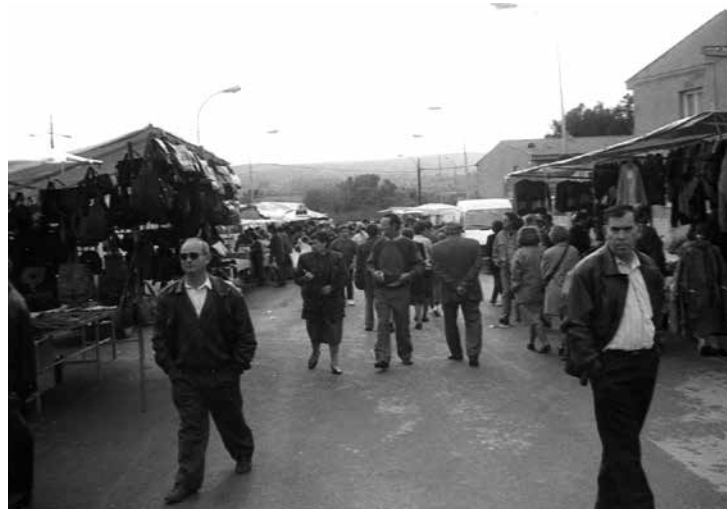
Els primers temps del mercat van ser difícils però es va anar consolidant

L'any 2014 es va incorporar la construcció d'un nucli d'entrada al mercat amb dos mòduls que inclouen un punt d'informació turística, magatzem i lavabos pels visitants. ➤