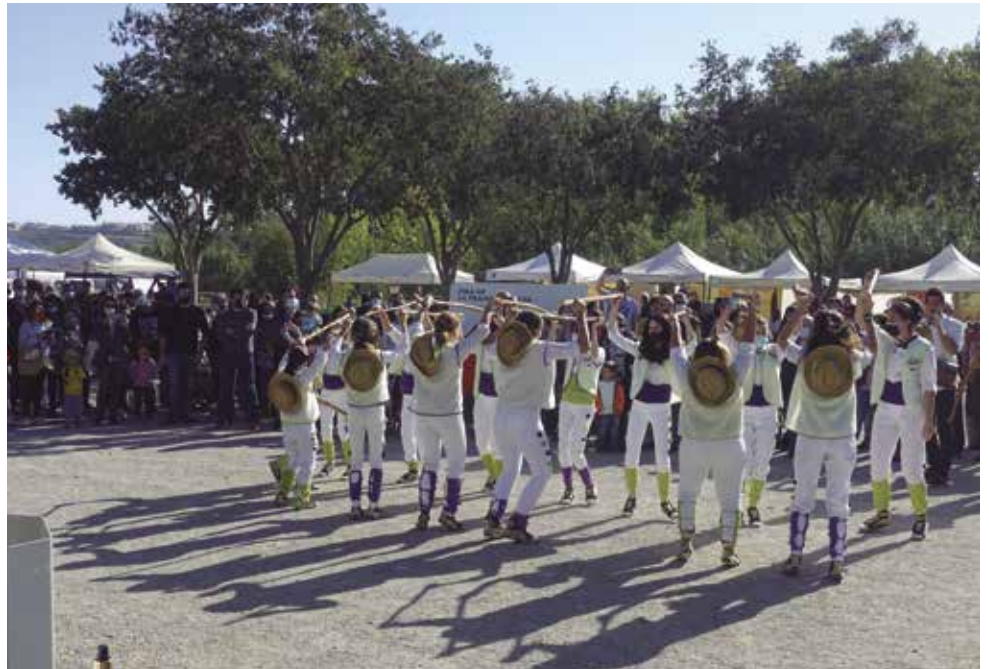
Actuació de ball de les pastoretes dels Monjos durant la celebració de la Fira de Transhumància de l'any 2021

La Fira de la Transhumància és un esdeveniment que s'emmarca en el projecte "Camí Ramader de Marina. De la Cerdanya al Penedès", que va néixer de la inquietud dels municipis de Santa Margarida i els Monjos, Lluçà i Llívia, entre altres organismes i entitats, i que té com a finalitat la preservació, potenciació i promoció de la transhumància i els camins ramaders a Catalunya, dedicant especial atenció a l'antiga ruta transhumant que ha permès el moviment de ramats entre el Pirineu i el litoral al Penedès i el Garraf, des de l'edat mitjana.