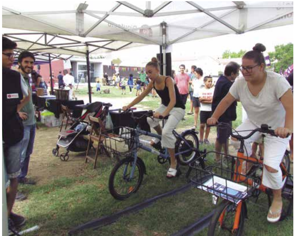
Assistents a la sisena Fira d'Extraescolars participen a l'activitat muntada a la carpa de la Diputació amb motiu de la Setmana Europea de la Mobilitat Sostenible