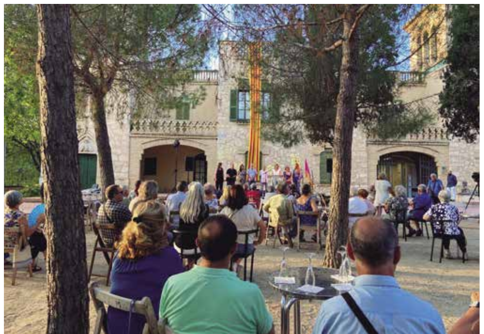
Més d'un centenar d'assistents van gaudir de l'Onze de setembre als jardins de Mas Catarro