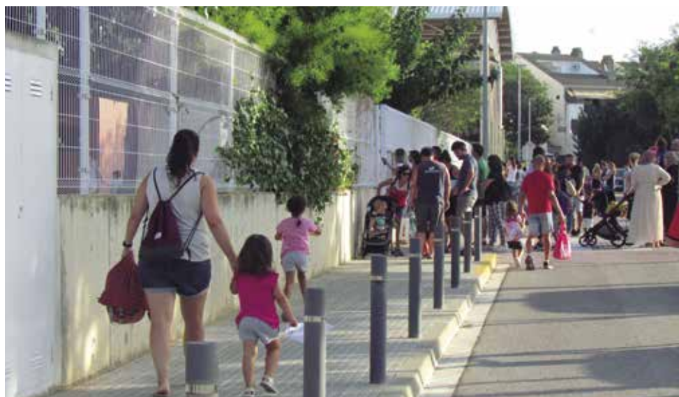
L'alumnat, acompanyat de mares i pares, es retroba el primer dia de curs a la porta d'entrada de l'escola Escola Sant Domènec

l'oferta acadèmica dels Plans de Transició al Treball (PTT) davant d'una trentena de persones, una via formativa que porta implementant-se a Santa Margarida i els Monjos des de l'any 2012. Dirigida a l'alumnat que no ha superat l'ESO,