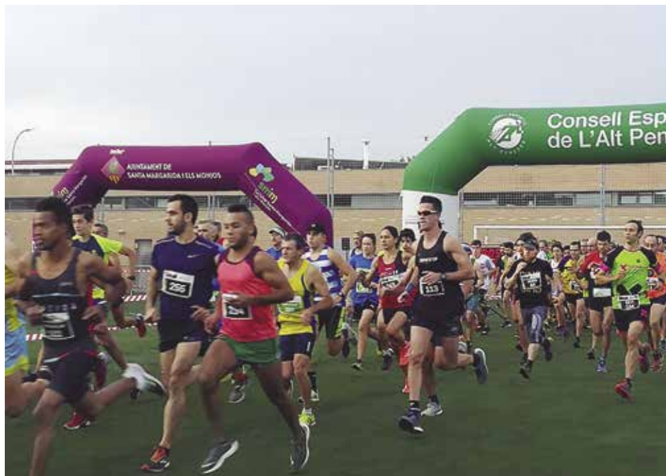
Sortida dels i les participants de les curses durant l'edició de l'any 2019

La competició de cros escolar començarà a les 11 del matí i les persones participants s'hauran d'inscriure i recollir i recollir el dorsal mitja hora abans de l'inici a la secretaria del camp de futbol. Des de l'organització es convida a col·laborar amb el banc d'aliments, portant oli, conserves o qualsevol aliment no perible, o fent un donatiu de cinquanta cèn-