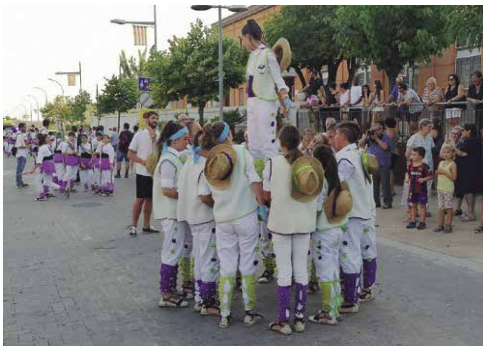
Els actes tradicionals i folklòrics van tornar a omplir els carrers i les places de Santa Margarida i els Monjos durant les festes majors

Pel que fa a la Festa Major de La Ràpita,