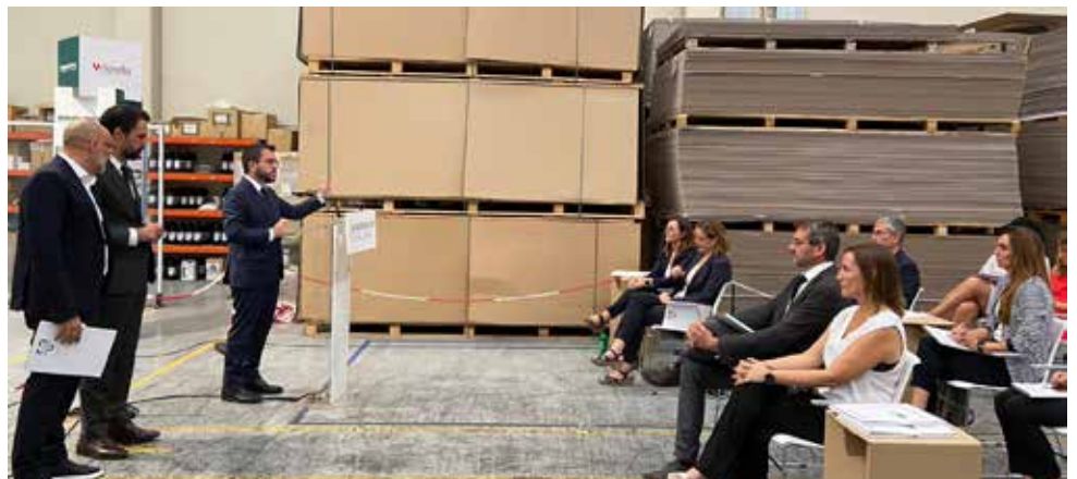
El president de la Generalitat de Catalunya, a la roda de premsa posterior a la visita, acompanyat del conseller d'Empresa i Treball del Govern de la Generalitat de Catalunya i el gerent d'Ondunova

innovador i de sostenibilitat i, també, va confirmar que el projecte compta amb una subvenció pública de 700.000 euros.