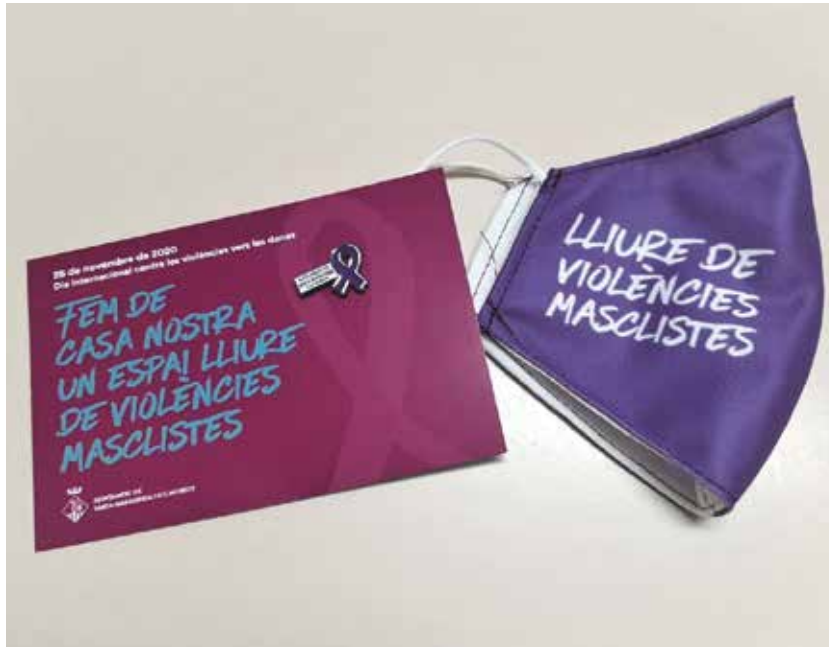
L'Ajuntament va repartir una mascareta i un pin a les llars del municipi

Una altra de les accions es va fer a l'escola Arrels, amb una hora del conte per a l'alumnat de 2n i 3r de primària, amb