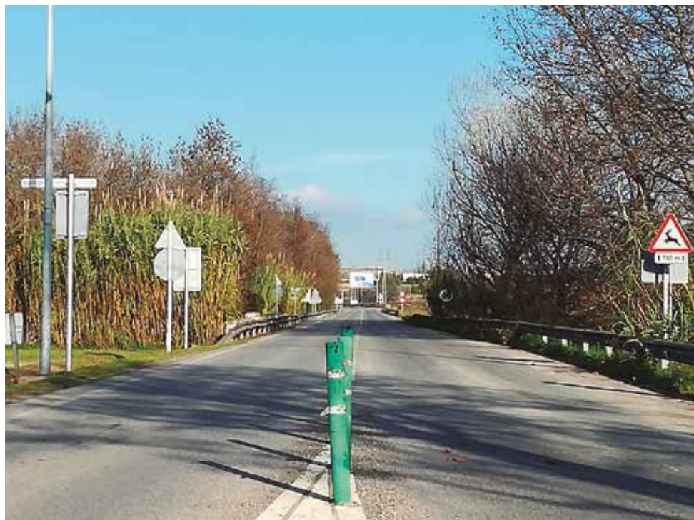
El tram del municipi que es convertirà en eix cívic té una longitud de 625 metres.

A partir d'aquest punt la carretera segueix tram molt planer mentre les vinyes es van enfonsant cap a la riera, fet que obliga cada vegada més a fer un talús més llarg. Per tal de reduir ocupació de vinya, es proposa fer una escullera de sosteniment que arriba fins el pont de la riera. El pas de la riera es resol mitjançant un voladís lleuger, ancorat al pont existent, de menor amplada que el carril on en aquest espai conviuran les bicicle-