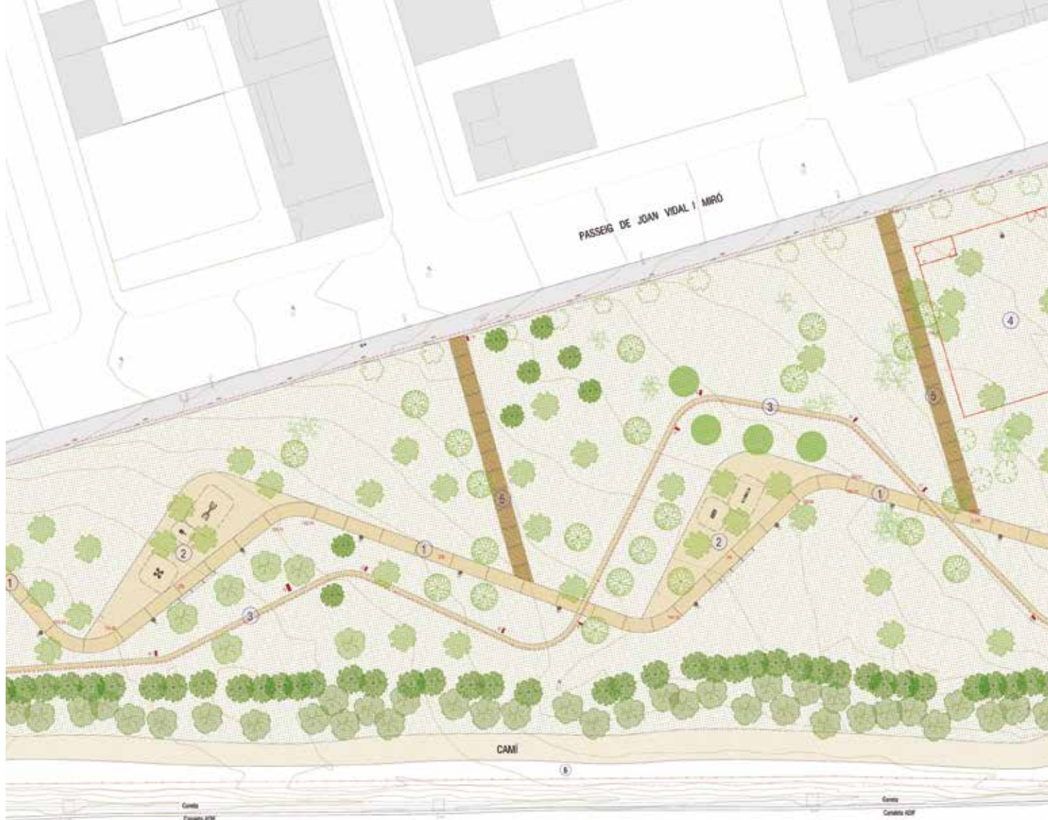
El Parc de Llevant ocuparà 12.900 metres quadrats entre el Passeig Joan Vidal i la via del tren.

drà un passeig, amb dos punts pensats com a espais de repòs i també d'activitat física, amb la instal·lació d'aparells per practicar exercici físic. En aquest sentit, s'hi ha dissenyat un recorregut permanent de cros que discorre pel parc. En un extrem del parc s'habilitarà una zona destinada a l'esbarjo caní, on els gossos hi podran estar deslligats. L'arranjament del parc té un pressupost de 154.000€.