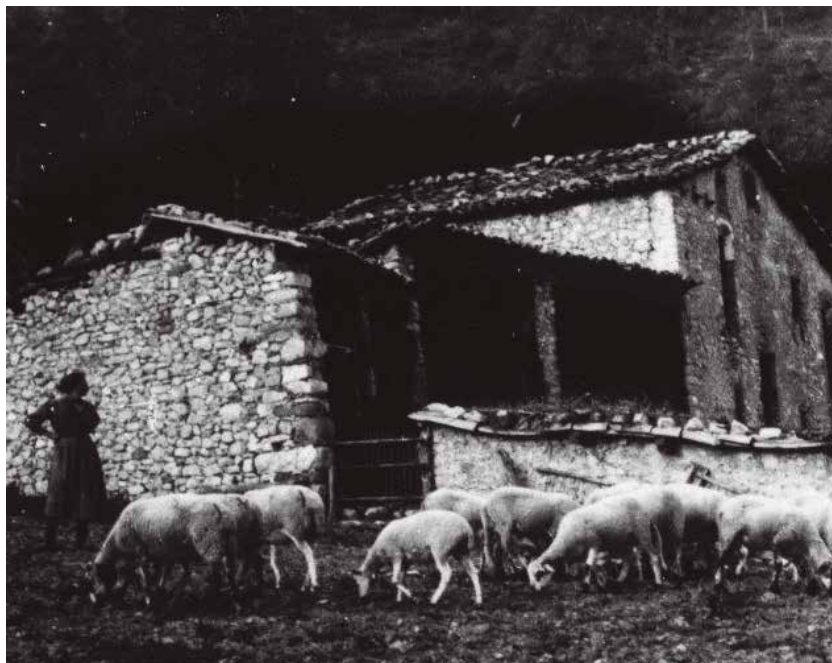
Una de les imatges que es publiquen al llibre i forma part de l'exposició

Una de les primeres accions que s'han dut a terme en aquest sentit ha estat l'exposició "Dones invisibles? Dones i món rural a començaments del segle XX", que fins el 21 de desembre es pot