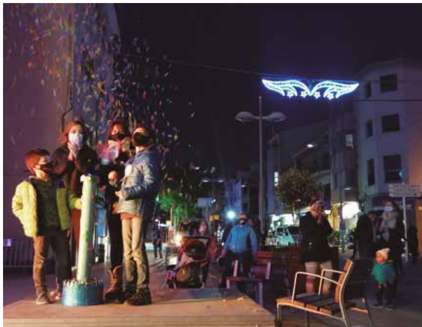
Enguany no ha faltat l'acte de l'encesa tot i que ben diferent d'altres anys

Els dies 22, als jardins de la Casa de Cultura Mas Catarro dels Monjos, i 23 de desembre a la plaça Ramon Cabré de