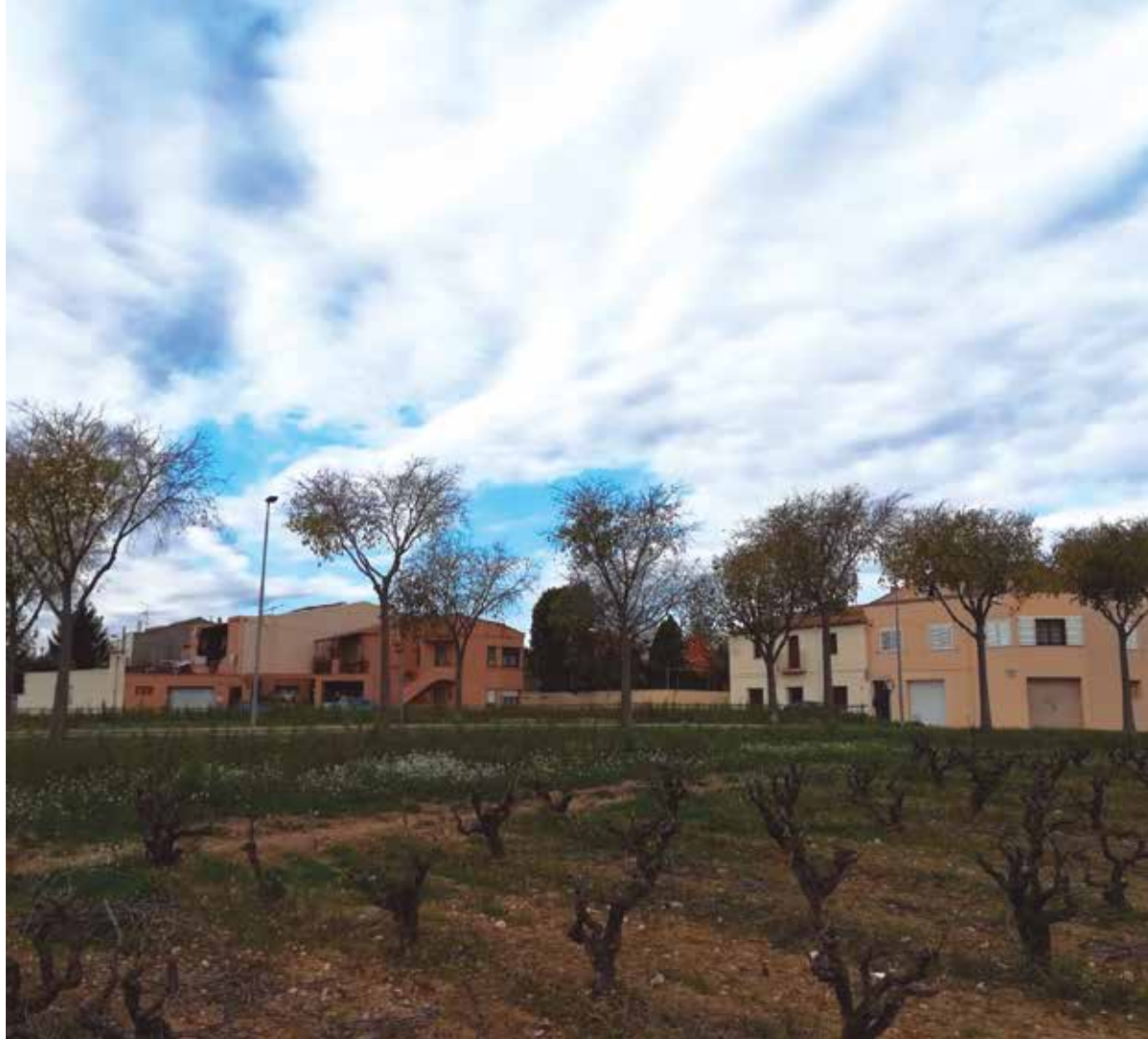
Cal Rubió és una de les zones on es farà la prova pilot.

campanya informativa i de sensibilització entre el veïnat i d'un procés de seguiment previ i posterior del funcionament, amb una valoració final de resultats.