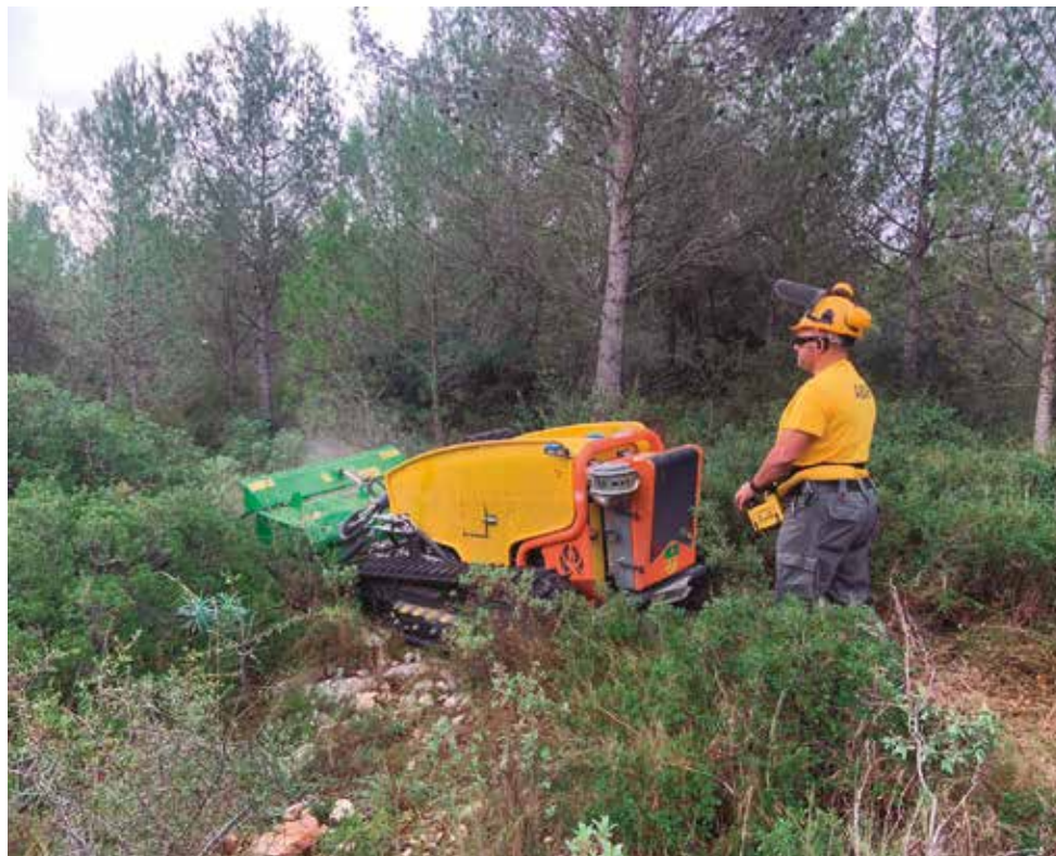
Un operari en ple desbrossament del bosc.

L'Associació de Defensa Forestal Penedès-Garraf ha dut a terme un desbrossament al bosc de l'Albornar i la muntanya d'Espitlles, una de les dues accions pilot del Pla d'acció per a l'adaptació al canvi climàtic de l'Alt Penedès, una acció finançada pel projecte europeu Life Clinomics.