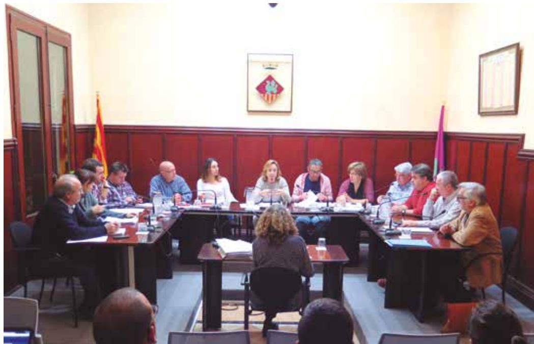
S'han incorporat diverses bonificacions per a la taxa d'escombraries.

També s'han incorporat bonificacions del 30% en la taxa de recollida dels residus per a famílies que tinguin algun integrant en situació d'atur de llarga du-