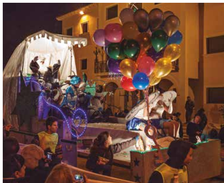
La cavalcada modifica el seu recorregut i acabarà a la Rambla de Penyafel

Finalment un any més el pavelló municipal d'esports acollirà el parc d'inflables Boti-Boti del 28 al 30 de desembre de 4 a 7 de la tarda. El parc està pensat