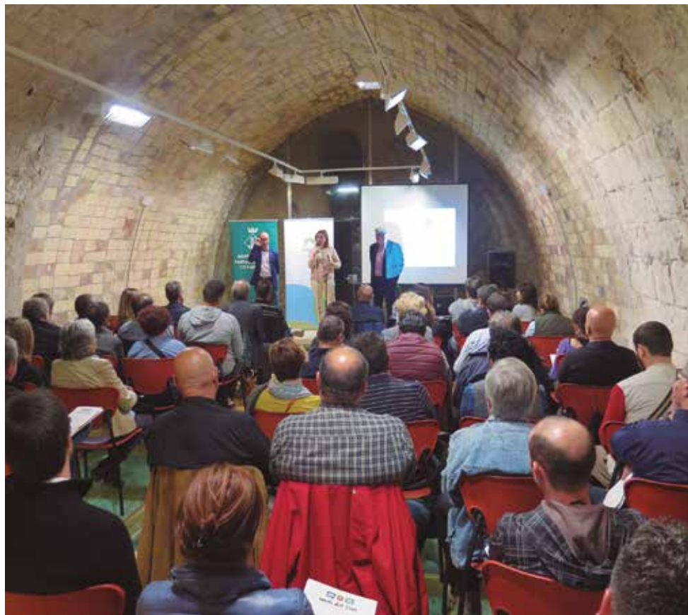
Presentació del Pla de Desenvolupament Turístic.

L'Ajuntament de Santa Margarida i els Monjos ha fet una aposta per la dinamització turística i dels atractius naturals i patrimonials del municipi amb la presentació d'un Pla de desenvolupament Turístic elaborat conjuntament amb la Diputació de Barcelona.