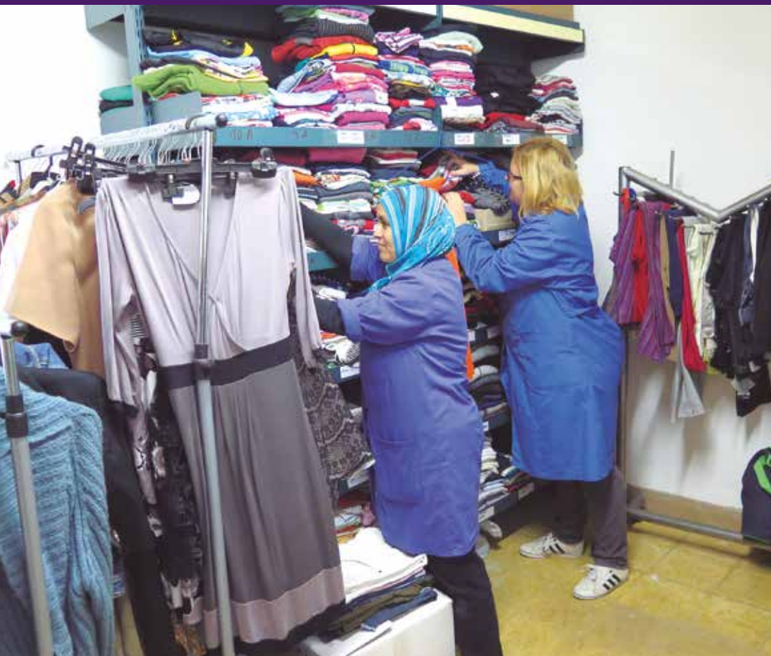
El Banc de Roba pretén dignificar la vida dels seus usuaris.