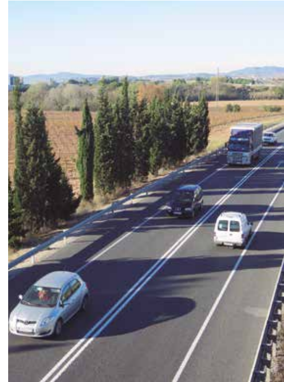
El pacte denuncia l'estat de la N340.

L'acord dels portaveus dels grups municipals de l'Ajuntament denuncia també l'estat de la N-340, carretera principal de comunicació del municipi i per la que circulen entre 20.000 i 30.000 vehicles diaris, quantitat que s'incrementa especialment amb l'arribada del turisme a l'estiu.