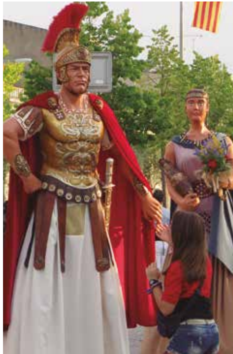
5è Aniversari dels Gegantons.

Els actes finalitzaran diumenge amb l'ofici en honor de sant Domènec, el cant dels goigs amb la coral l'Amistat