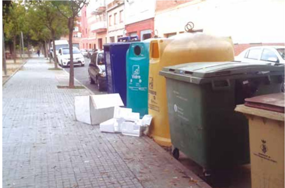
Els voluminosos no es deixen al terra, al costat dels contenidors.

Si no és així, les despeses de neteja i recollida aniran pujant i acabaran repercutint en les butxaques dels ciutadans a través dels seus impostos, ja que malgrat que existeixen nombroses bonifi-