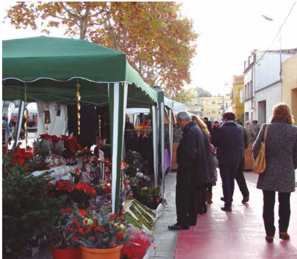
La Fira de Nadal, una de les primeres activitats de les festes.

Un altre dels clàssics nadalencs del municipi és el Parc Nadalenc Esportiu que es fa a la pista de l'avinguda de Ca-