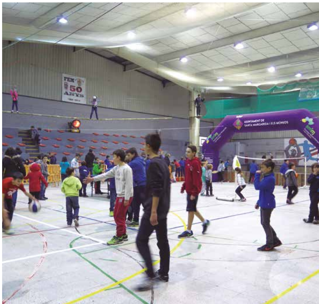
Parc Nadalenc esportiu a la pista.