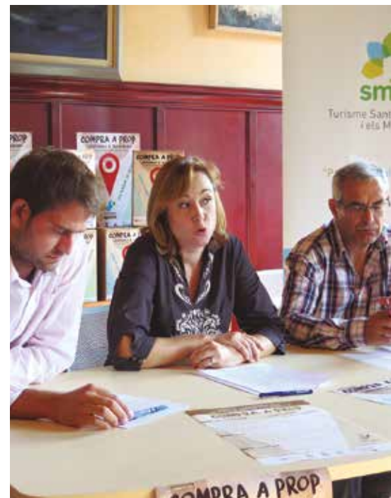
Presentació de la campanya.

La campanya és una de les primeres iniciatives de treball conjunt que veu