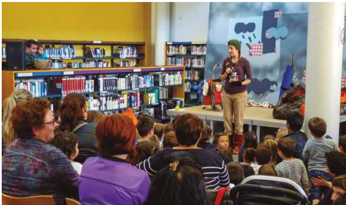
Lectures i activitats a La Biblioteca.

La Biblioteca continua sent actualment un espai de referència en l'àmbit de Santa Margarida i els Monjos i de la comarca de l'Alt Penedès, no tan sols pel seu fons, sinó també per les iniciatives que duu a terme i les nombroses activitats culturals que promou. ➤