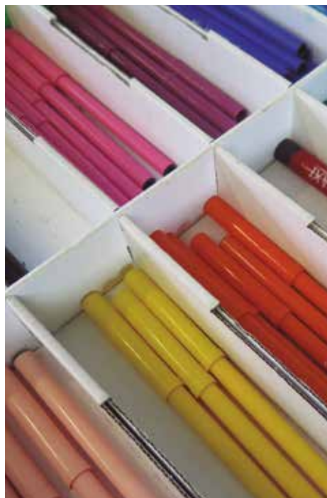
Obertes les preinscripcions 2016

En el cas de l'institut El Foix, la jornada