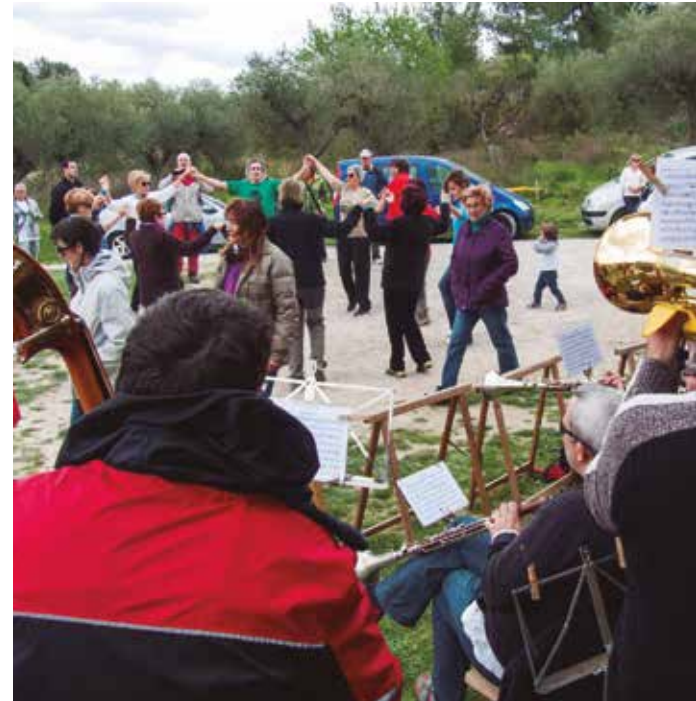
Aplec de Penyafel.

L'Aplec de Montanyans, que enguany celebra la seixanta-unena edició, començarà amb la Solemne Missa, en