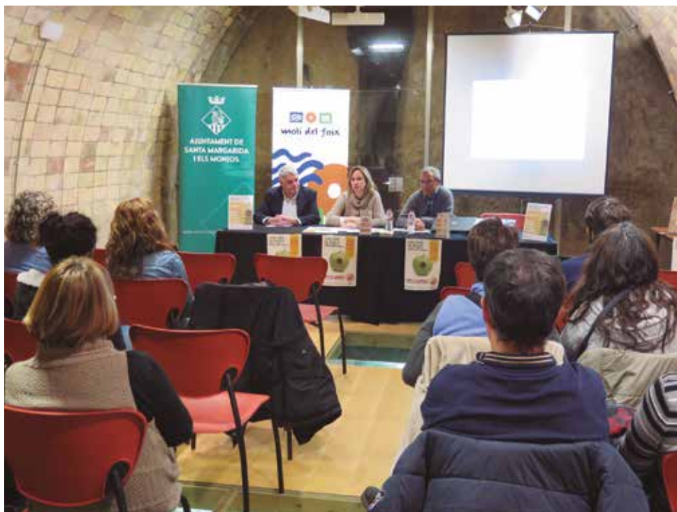
Presentació de la campanya Som gent de profit.

Durant la campanya s'habilitaran bústies als equipaments municipals en les que es podran deixar idees de reaprofitament i entre totes les propostes presentades es farà el sorteig de tres àpats per a dues persones en alguns dels establiments col·laboradors.