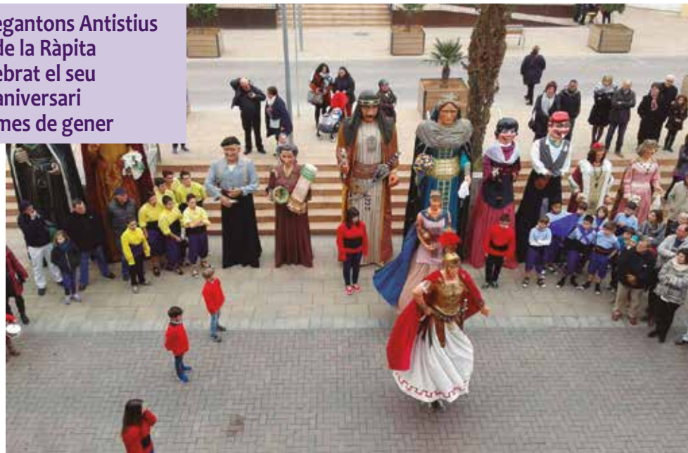
Festes Majors d'hivern als Monjos i la Ràpita.

Els gegantons Antistius i Ginur de la Ràpita han celebrat el seu cinquè aniversari aquest mes de gener