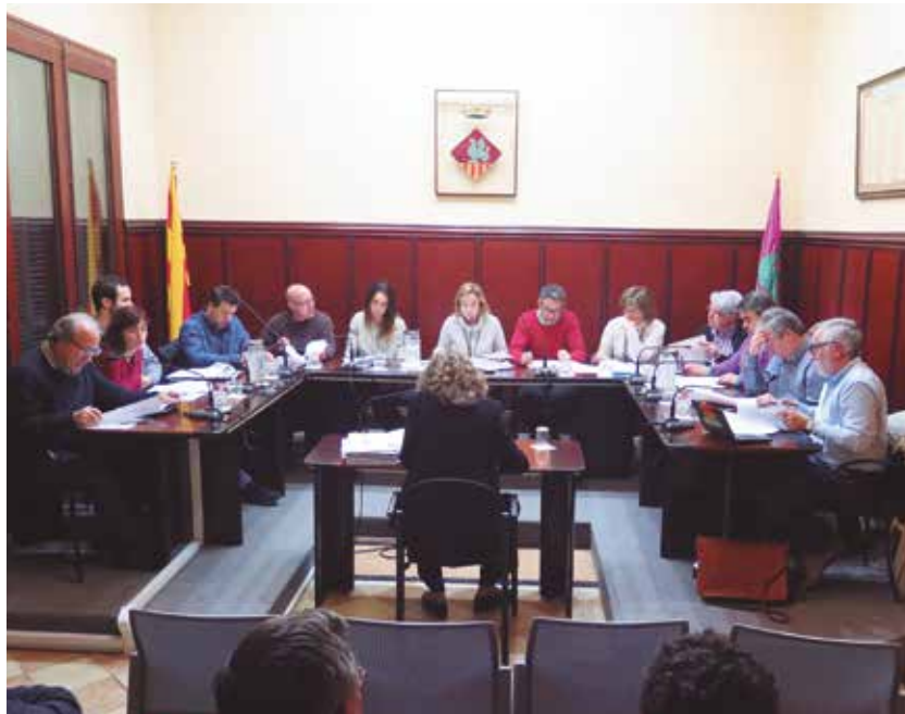
El plenari és l'encarregat d'aprovar el pressupost municipal.

Els comptes estan especialment centrats en la contenció o disminució de la despesa, en aquells capítols en els que ha estat possible, i l'increment ve donat per el foment d'accions que tinguin cura de l'atenció a les famílies i impulsin accions d'ocupació, cooperativisme, economia social i formació. En aquest sentit es continuen esmerçant molts esforços per corregir situacions que poden com-