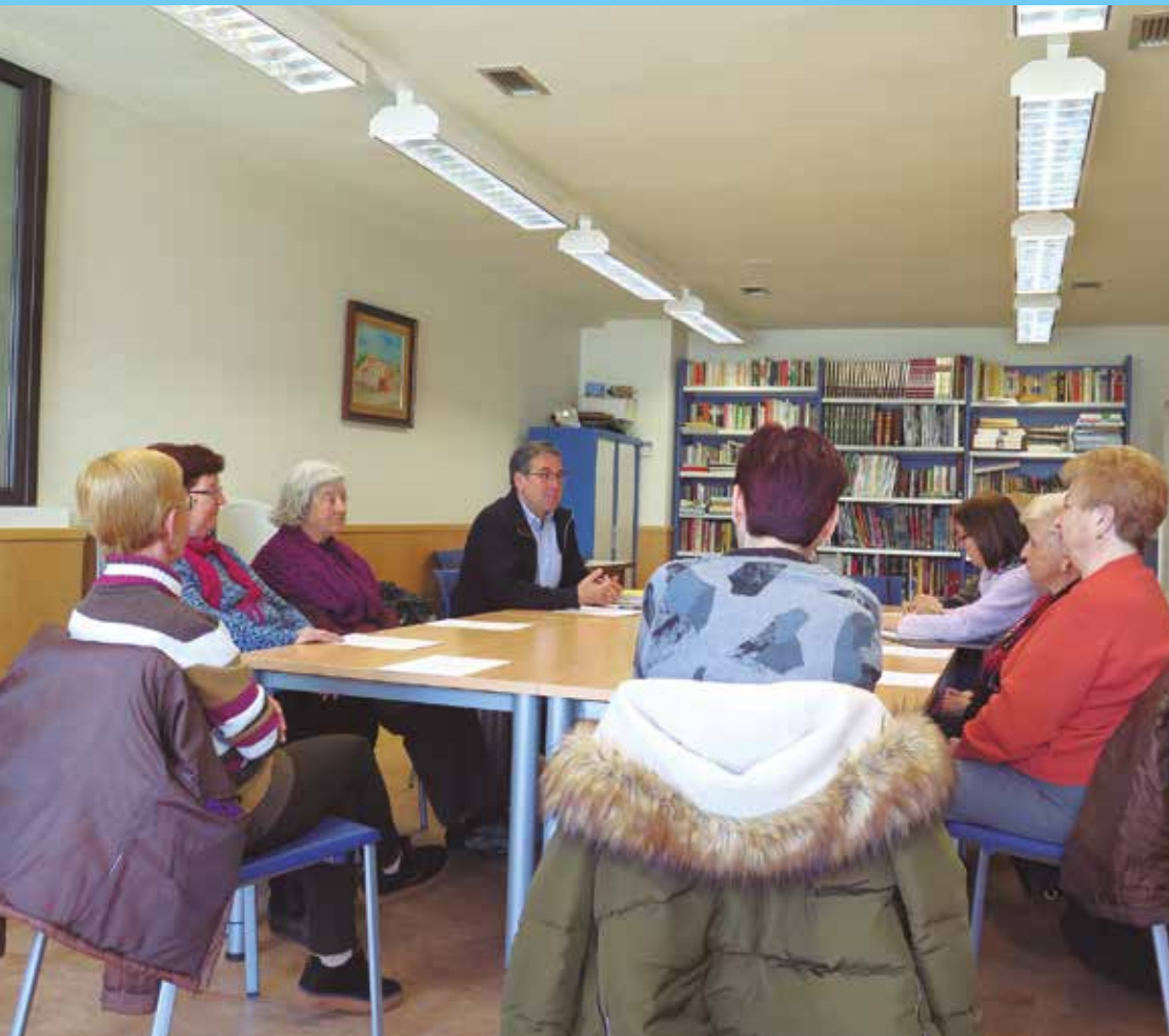
El grup d'ajuda mútua de Santa Margarida i els Monjos és dels més actius de la comarca