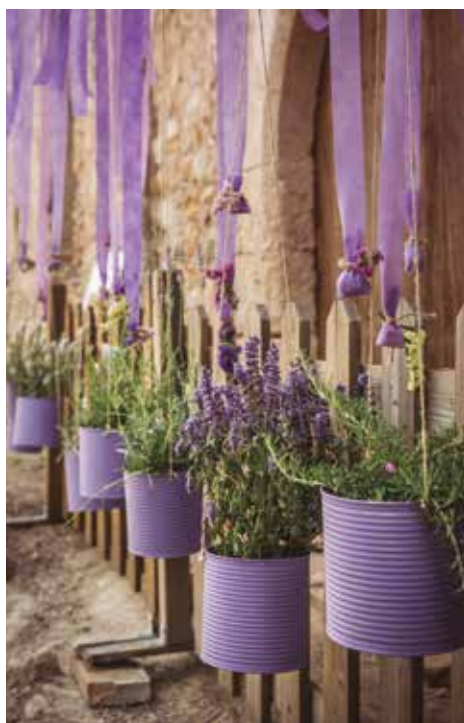
L'art floral, un dels protagonistes de la Fira d'enguany