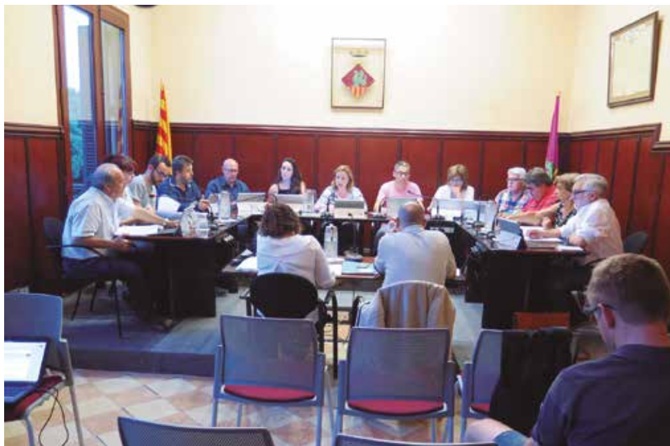
corporació municipal de Santa Margarida i els Monjos

Al juny, a la següent sessió plenària, l'Ajuntament va fer palès el posicionament unitari de la corporació contra la violència masclista i per continuar treballant com fins ara per l'erradicació d'aquesta xacra i la protecció de les víctimes. El plenari va aprovar una moció presentada pel grup de PA-CUP