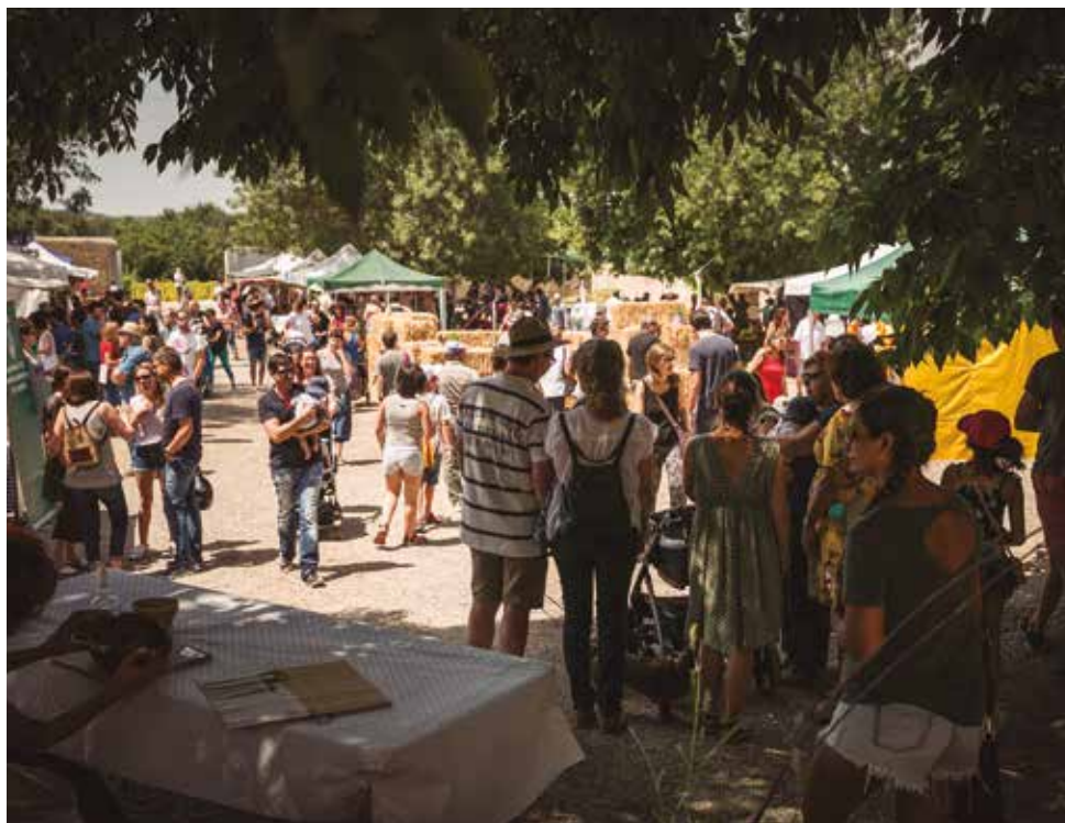
La Fira va comptar amb una nova distribució dels seus espais

La part de la difusió del coneixement sobre herbes la va protagonitzar l'Herbes Campus, que aquest any es va dedicar a les tintures, amb ponents i participants que van arribar d'arreu del país.