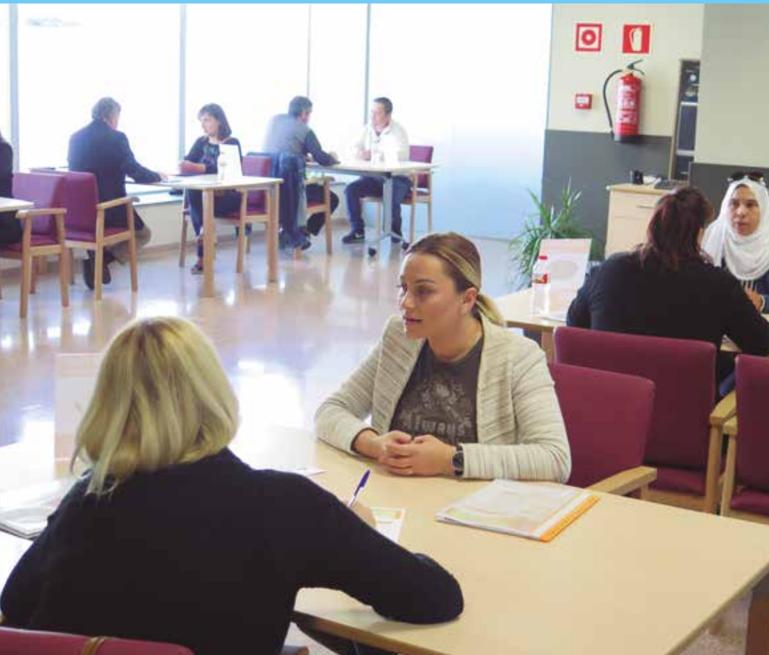
Primera trobada d'Speed Date a l'Espai per l'Emprenedoria.