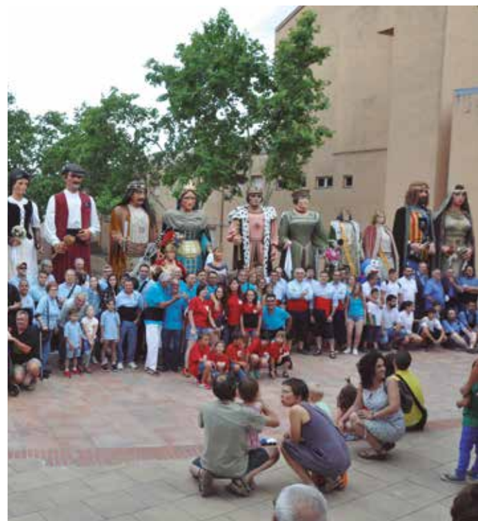
Trobada de gegants a la Ràpita

La cita també va comptar amb la participació dels gegantons de la Ràpita Antistius i Ginur.