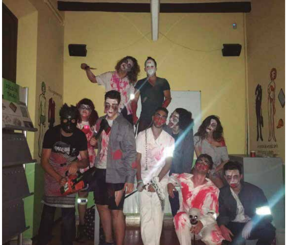
El survival zombie és una de les propostes originals que el Tangram ofereix a l'estiu.

Al mes de juny, el Tangram va treballar colze a colze amb el Ball de Diables de