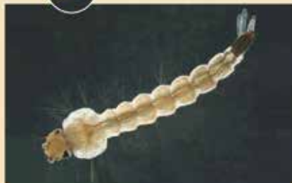
Imatge ampliada d'una larva del mosquit tigre.