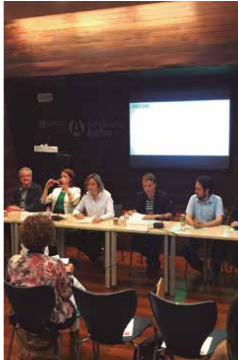
Constitució de la Xarxa

L'associació s'ha constituït per promoure, reforçar i consolidar l'economia social i solidària, fixar estratègies comunes i fomentar l'acció conjunta dels diferents municipis alhora d'impulsar polítiques públiques per fer de l'Economia