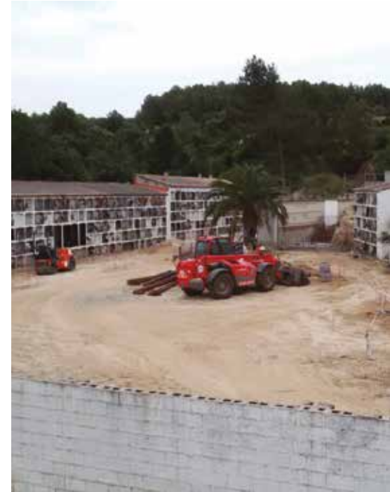
Les obres del cementiri municipal van a bon ritme.

Els treballs és previst que finalitzin la