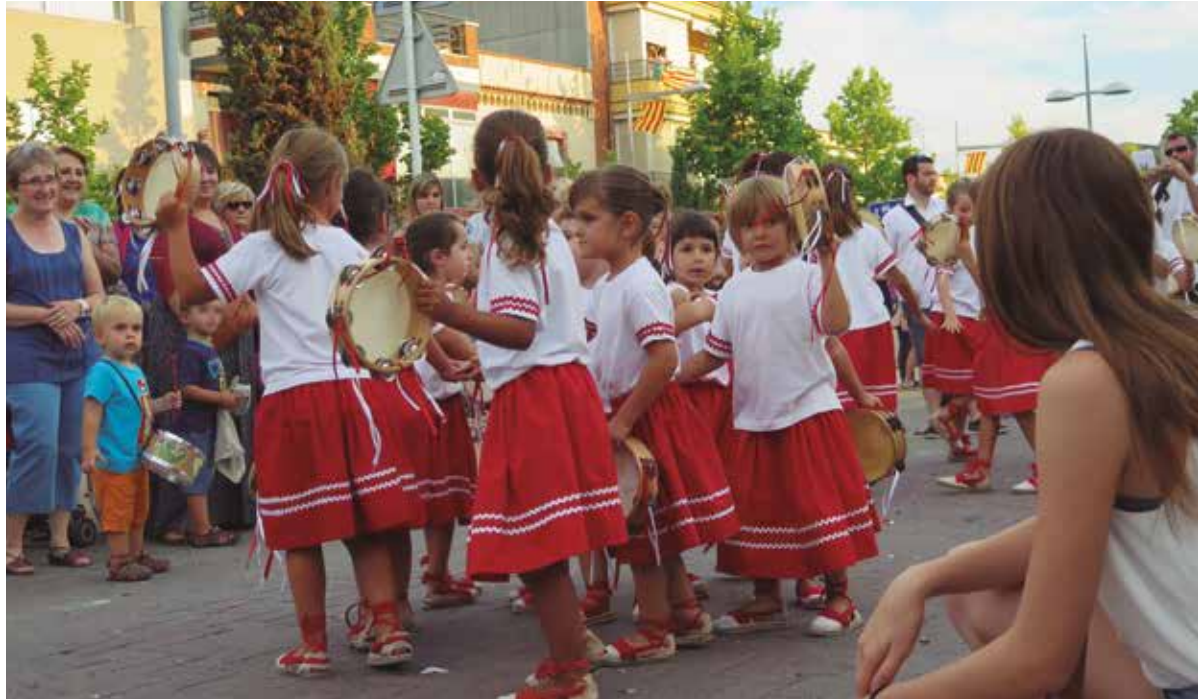
Les festes majors potencien un fort component folklòric tradicional.

Organitzada des del Centre Cultural i Recreatiu Rapitenc, presenta enguany una variada oferta tradicional i lúdica per a tots els públics. La festa centrarà les seves activitats en el cap de setmana del 5 i 6 d'agost i inclourà alguna de les seves propostes més tradicionals, com ara les cercaviles folklòriques o l'acte sacramental dels Diables i les sàtires, amb la Fogardera. Pel que fa a les actuacions, aquest any destaquen les de JK Sax, al concert sota les estrelles que es farà el 2 d'agost, la tarda de circ del dia 6 o el concert i ball de l'orquestra Nova Blanes el dia 7.