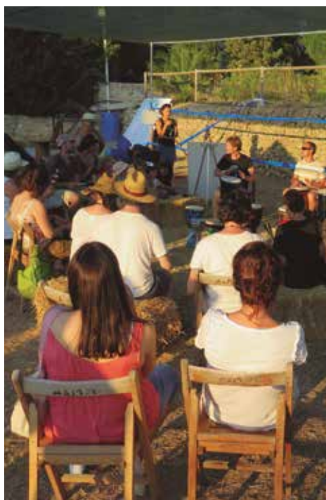
La difusió del coneixement sobre les herbes és fonamental al Remeiart.