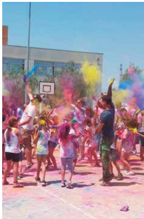
Festa d'aniversari de l'escola Arrels

L'escola Arrels es caracteritza per distribuir les seves activitats, a partir del currículum del Departament d'Ensenyament de la Generalitat, en activitats lliures i dirigides. Les lliures afavoreixen