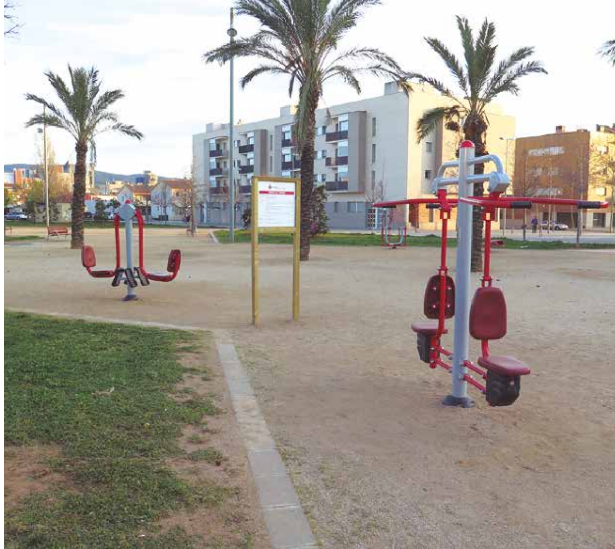
L'espai situat a l'av. de Cal Rubió s'anomena des d'ara Parc de la República.

El plenari va acordar l'aprovació inicial de la modificació del projecte bàsic i executiu de rehabilitació del celler del Castell de Penyafort com a sala d'ús polivalent i el nou edifici de serveis higiènics d'ús públic. La proposta va comptar amb els vots favorables de PSC i CIU i el