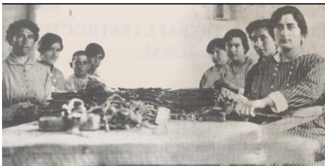
1 Avinguda Catalunya, 13-15

Dones treballant en activitats agrícoles. (Fotografia de Maria Moreno, del llibre La gent i el seu temps ).