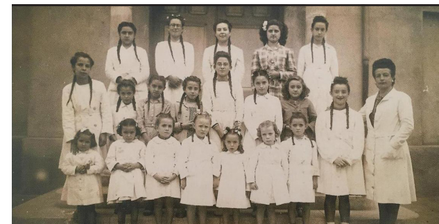
3 Avinguda del Penedès, s/n (Edifici de la Llar d'Infants de la Ràpita)

Aquest recorregut el podeu realitzar de forma lliure el dia i hora que us vagi bé. A més d'aquest desplegable, trobareu un codi QR a cada punt en el que podreu escoltar l'explicació ampliada.