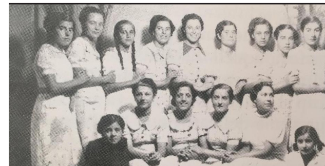
4 Parc de la Memòria, camí del Fondo, s/n (CIARGA)