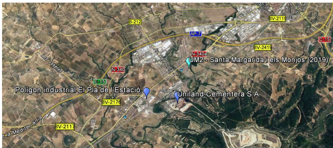
Figura 3: Perspectiva de la localització de la unitat mòbil 2 (UM2), context més general i posicionament respecte a les carreteres principals.