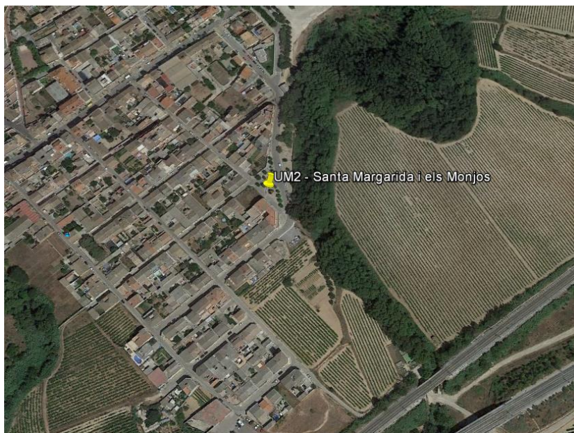
Figura 2: Entorn més proper de la ubicació exacta de la unitat mòbil 2.