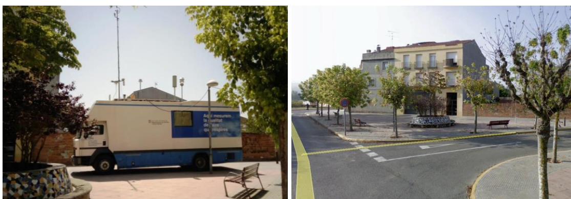
Figura 1: Imatges de la ubicació exacta de la unitat mòbil 2 al creuament entre el carrer Vinyes i el carrer la Plata.