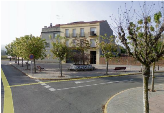
Figura 1: Imatges de la ubicació exacta de la unitat mòbil 2 al creuament entre el carrer Vinyes i el carrer la Plata.

Es tracta d'una zona suburbana industrial (