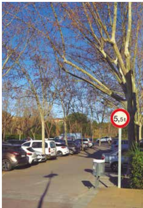
El nou punt estarà a l'aparcament de l'ajuntament

El sector del transport és responsable del 42,9% del consum d'energia final a Catalunya. Per això, i amb la voluntat de lluitar contra el canvi climàtic és molt important incentivar la mobilitat