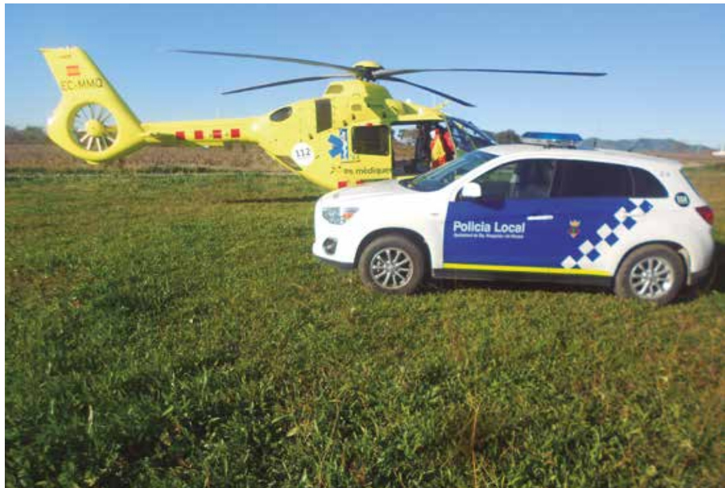
La coordinació és essencial en temes d'emergències

A Santa Margarida i els Monjos el cos de la Policia Local neix com a tal, l'any