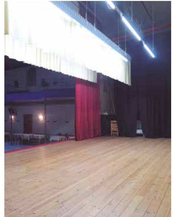
Novetats a la societat La Margaridoia

El 22 de febrer es farà el ball de carnaval, amb entrada gratuïta a totes les disfresses de cos sencer i premis per a les millors. L'endemà diumenge es farà el carnaval infantil i l'1 de març es celebrarà la calçotada social. El dissabte 21 de març tindrà lloc l'assemblea general de socis, amb la representació d'una obra