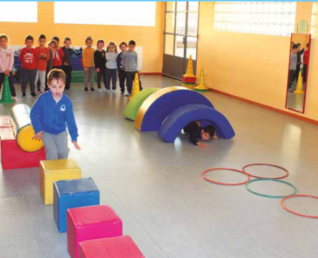
L'esport fomenta diversió i nous reptes pels infants