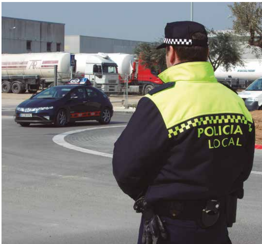
La policia fa tasques de prevenció i seguretat

També es treballa la violència de gènere, amb una agent encarregada del seguiment d'ordres d'allunyament, entrevistes amb les víctimes, coordinació amb Mossos, etc; i seguiments especials en coordinació amb les escoles en cas que es detectin alertes de presumptes casos de pedofília, seguiment de 'bullings' o altres. En aquests casos es