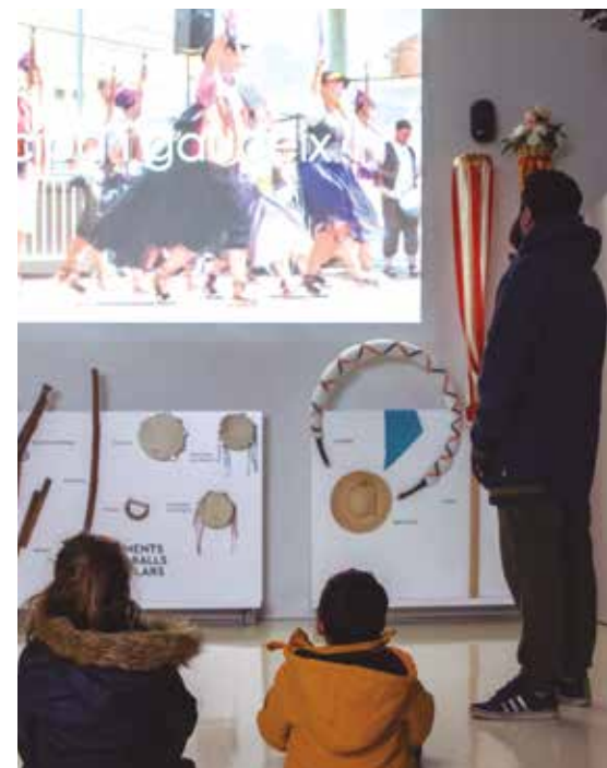
Activitats familiars a La Quadra

de recursos educatius per a alumnat de primària i secundària.