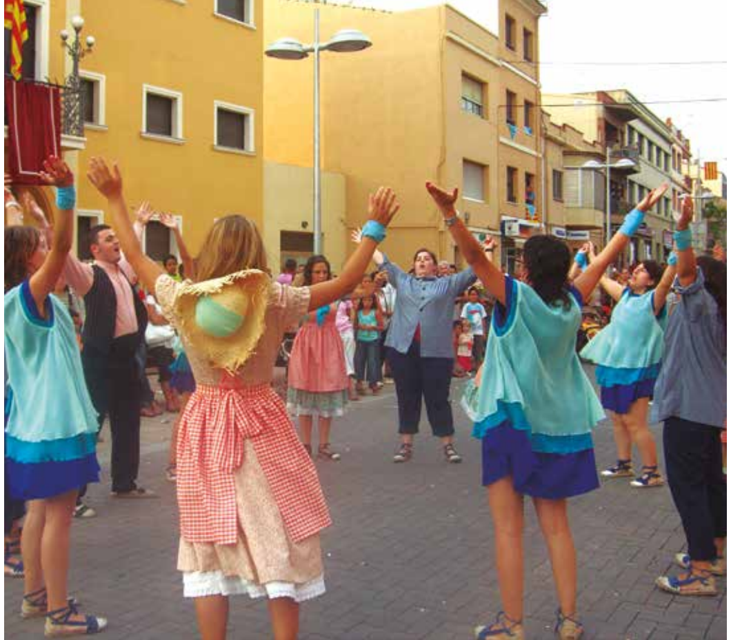
El ball del Foix és l'únic ball autòcton del municipi

Per a inscripcions i consultes la secretaria de la societat és oberta els dimarts de 18 h a 20 h o bé al correu s.c.e.lamargaridoia@gmail.com i al facebook.