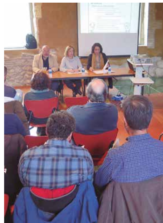
Assemblea del CRM