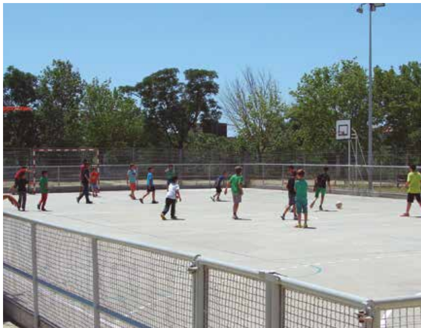
La millora dels patis va ser un projecte presentat per les AMPA

A l'institut El Foix es crearà una zona comuna amb la col·locació de taules de pícnic pels àpats i per la socialització de l'alumnat a l'hora de l'esbarjo. A l'escola Sant Domènec s'instal·laran noves estructures de joc, com ara una cabana