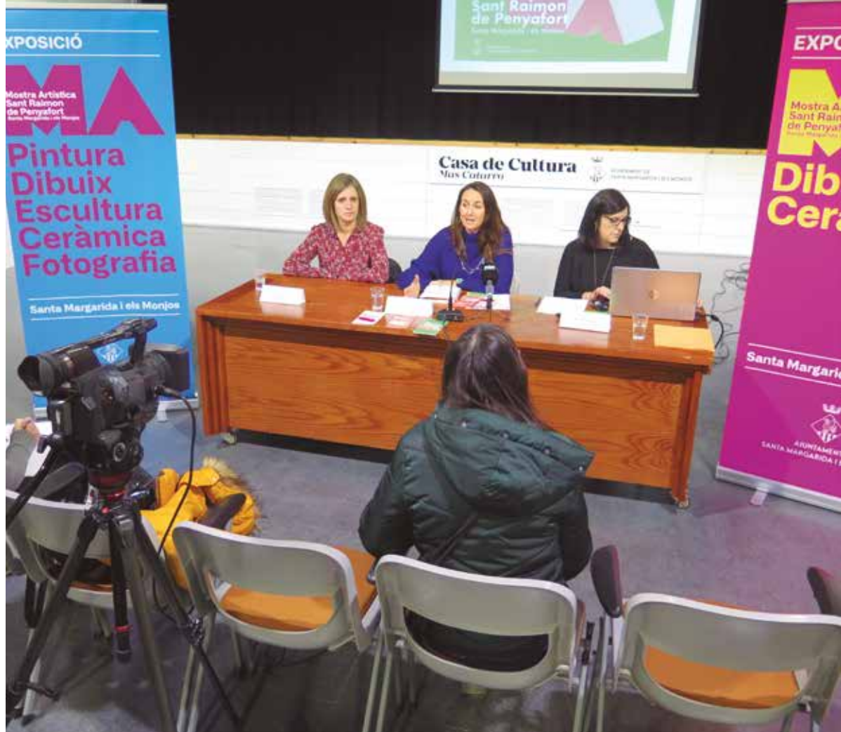
Presentació de la Mostra Artística 2019

Tot i que aquesta competència és de la Direcció General del Catastro, des de l'Ajuntament es fa saber que per qualsevol dubte o informació, les persones interessades es poden adreçar a l'oficina de Gestió Tributària, que es troba als baixos de l'Ajuntament i que atén els dimecres de 9 h a 14 h, a l'ORGT de Vilafranca situada al Carrer de la Lluna, 6, o al tel. 93 472 92 15.