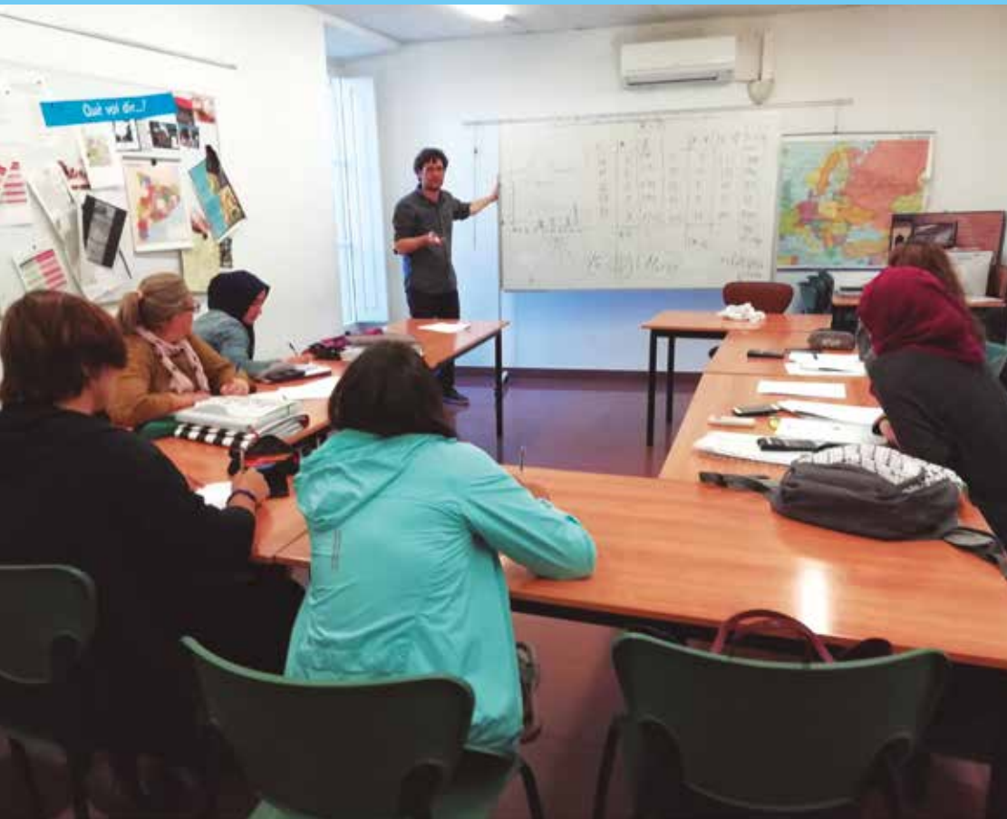
La formació és fonamental per a l'accés al mercat de treball