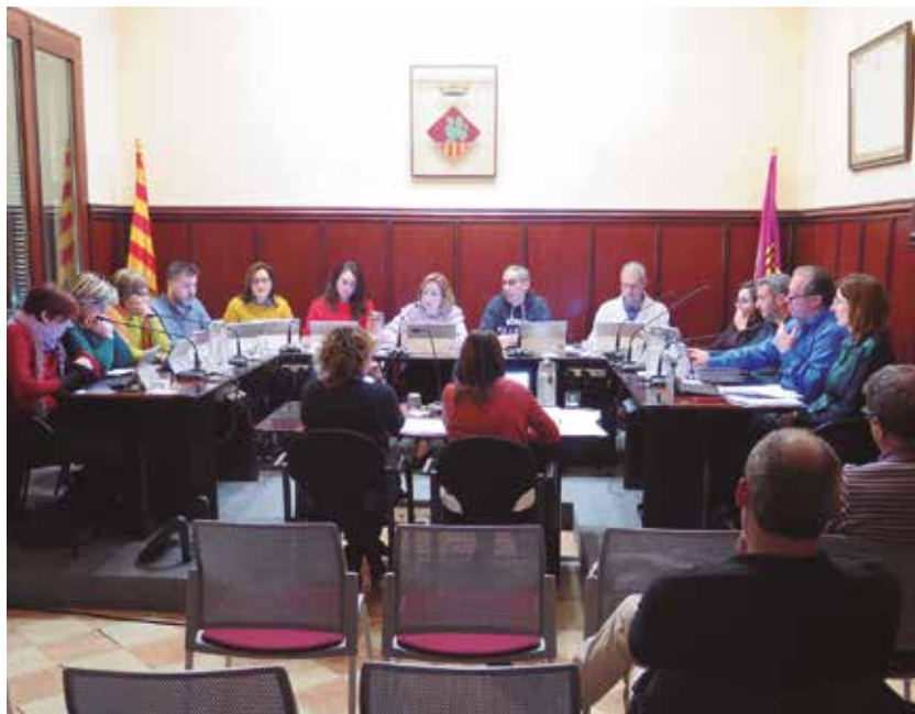
Plenari de l'Ajuntament de Santa Margarida i els Monjos

En el capítol d'inversions per aquest proper any s'ha mirat de preveure el major nombre de projectes possible, amb obres com l'arranjament de la canalització d'aigua de pluja al carrer de l'estació, cruïlla amb antiga N340; la creació d'un punt de recàrrega ràpida per a vehicles elèctrics; la continuació del projecte de millora del polígon Casanova i les millores contínues en espais públics i parcs com ara la renovació d'enllumenat vial amb millor eficiència energètica, o el projecte de centre d'interpretació del camí ramader de marina, entre d'altres. El pressupost del proper any 2020 no es descarten altres inversions que provenguin de possibles subvencions o de la incorporació d'excedents per majors ingressos.