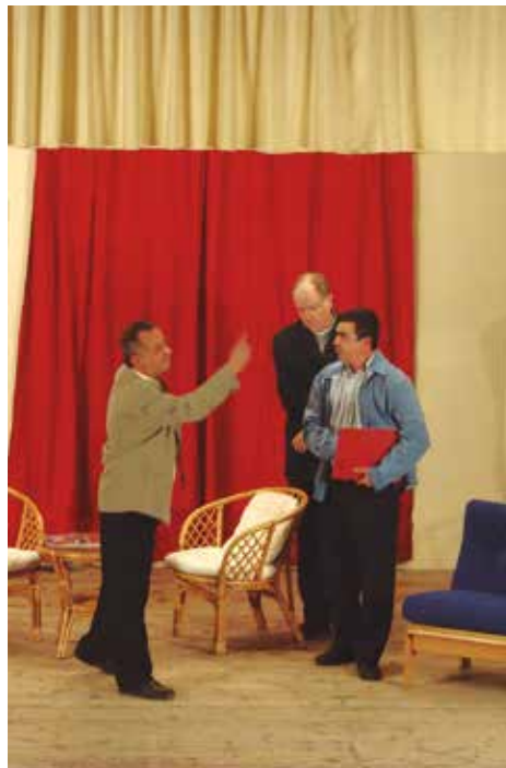
El teatre, un component habitual de les festes

Les activitats finalitzaran l'endemà diumenge amb l'ofici en honor de sant Do-